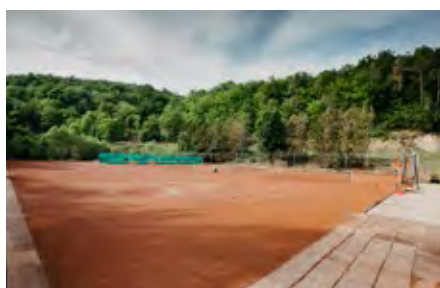
Die Tennisanlage erstrahlt in neuem Glanz.

Sportstättenweg 1, 3541 Senftenberg www.tksenftenberg.at E-Mail: senftenbergertk@gmx.at E-Mail: senftenbergtk@gmx.at Facebook: @senftenbergertk