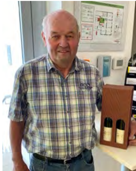
Dank an Franz Lagler für die „Entrümpelung“ der Plakatwand in Imbach.