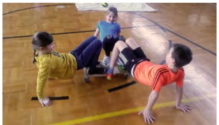
Sport hat einen hohen Stellenwert, dafür gab es eine Auszeichnung.