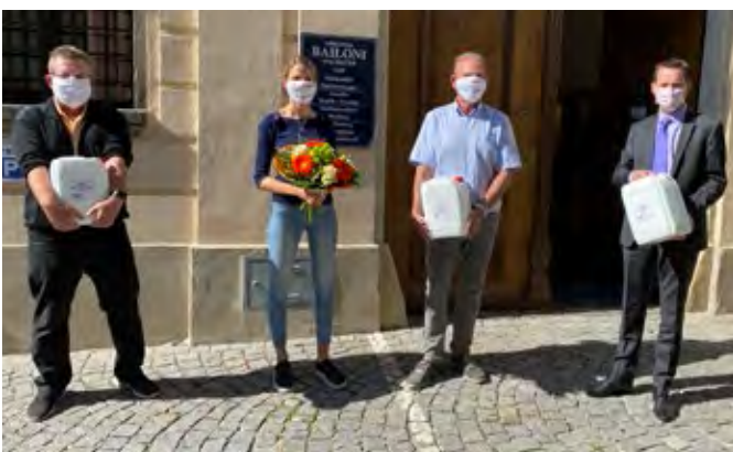
Die Firma Bailoni spendete 30 Liter Desinfektionsmittel.