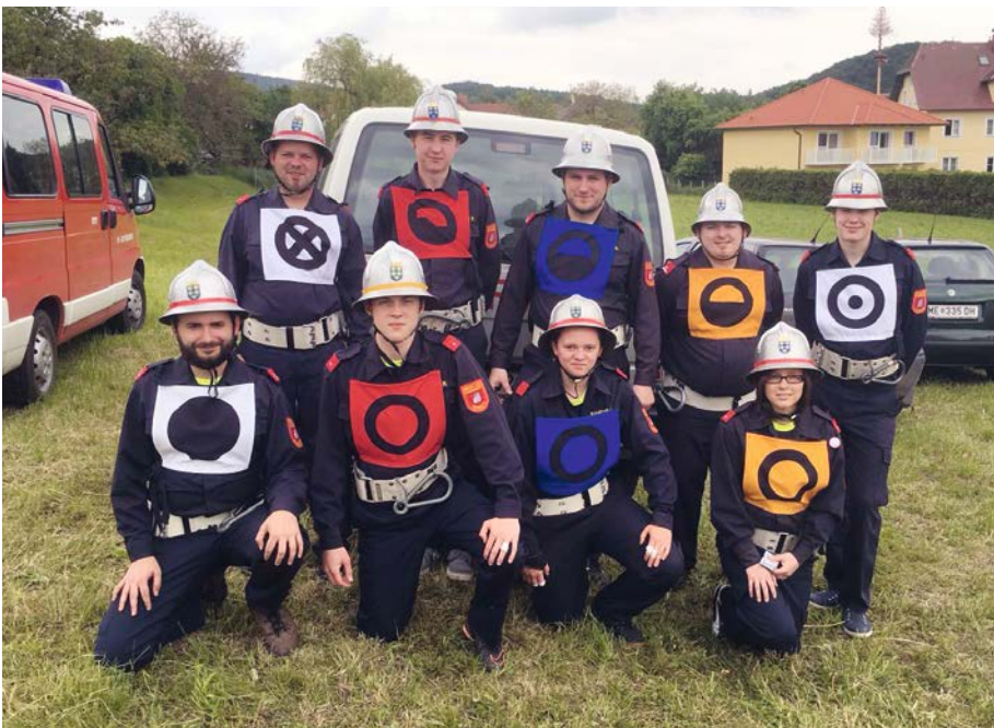
Die erfolgreiche Imbacher Wettkampfgruppe