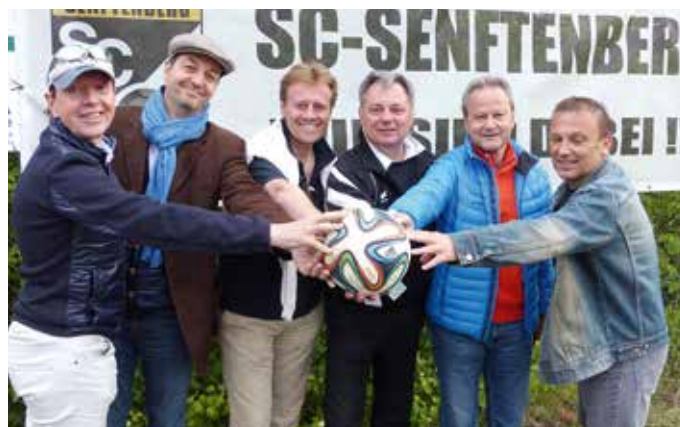
Sie ziehen an einem Strang für den SC Senftenberg.