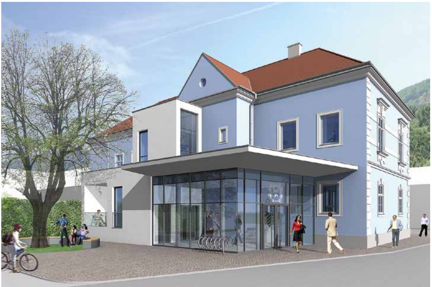
Das Senftenberger Rathaus präsentiert sich jetzt modern und barrierefrei