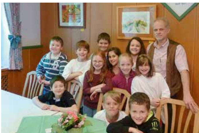
Betriebsbesichtigung im Gasthaus Hintenberger