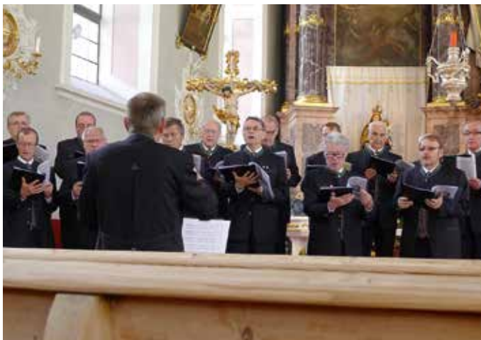
Messgestaltung in Neustift