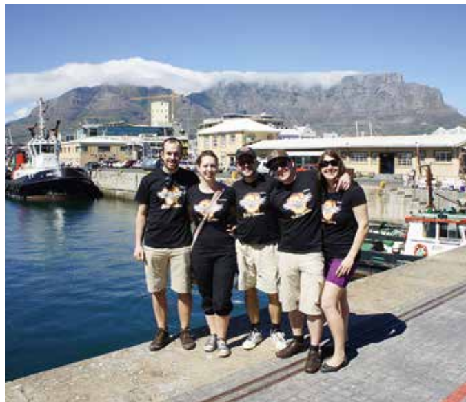
Die Senftenberger im Hafen in Kapstadt vor dem Tafelberg