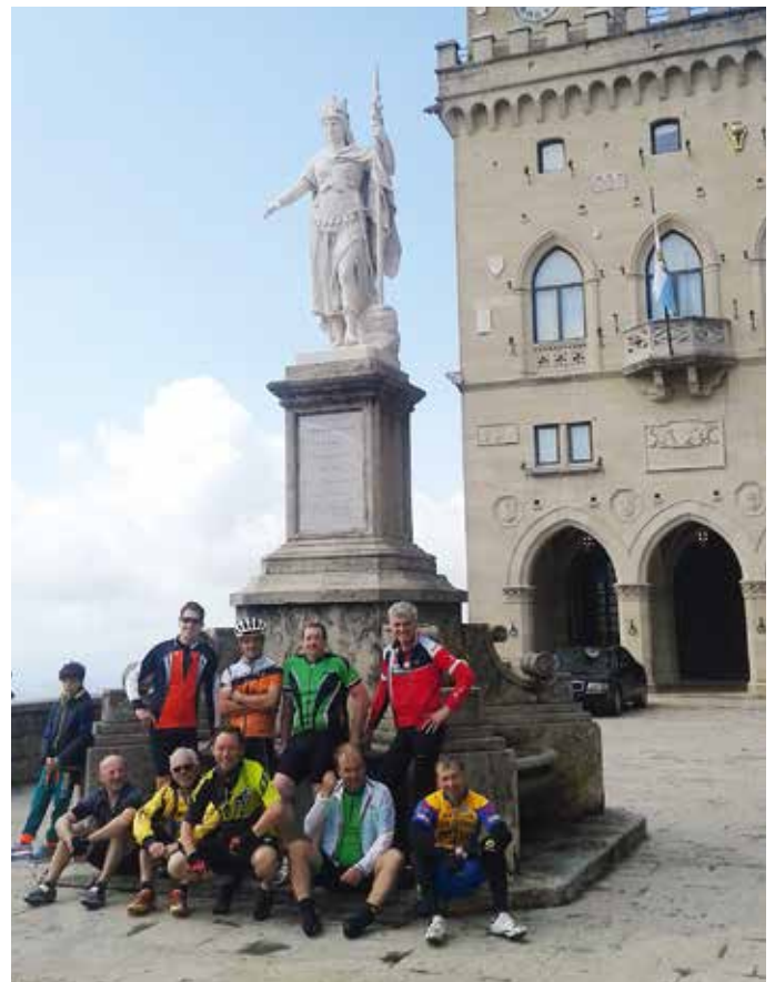
Im Frühjahr 2014 machte sich eine Gruppe radfahrbegeisterter Amateure aus unserer Gemeinde auf dem Weg in das „Radsport-Mekka“ Italien. Bei den täglichen Ausfahrten wurde die wunderschöne Landschaft rund um Cesenatico erkundet. Um die körperliche Fitness zu testen, wurden einige Berge, u.a. der Anstieg nach San Marino, bezwungen.