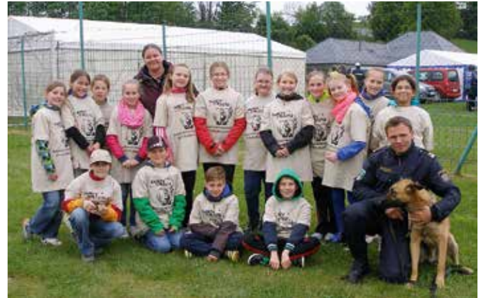
Safety-Tour in Albrechtsberg

Schüler auch bis 17 Uhr betreut. Nach dem Mittagessen wird die geführte Lernzeit eine Stunde von den Lehrpersonen gehalten, danach übernimmt eine Freizeitpädagogin die Betreuung. Die Räumlichkeiten dafür befinden sich im Untergeschoß des Schulhauses selbst. Schön ist es, dass aus diesem Grund der Schulgarten vergrößert wird, seitens der