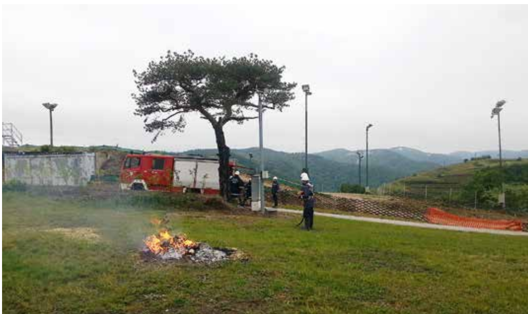
Die Feuerwehrjugend in „Action“ am 24 h-Tag

Die feierliche Zeremonie wurde in der Pfarrkirche Imbach in Kombination mit einer „Jubiläumsmesse“, zelebriert von Pfarrer Bräuer und musikalisch umrahmt vom Kirchenchor Imbach, gefeiert. Im Anschluss an den kirchlichen Festakt sprachen zum einen Bürger-