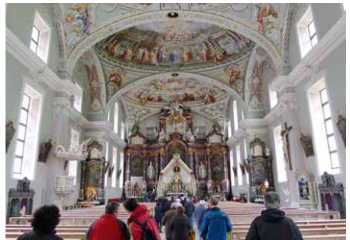
Besuch der Pfarrkirche Neustift