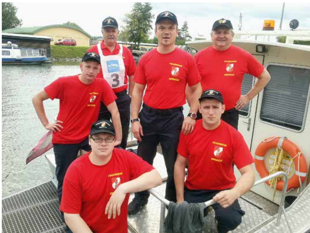
Pionierbootregatta: Die „Ruderer“ der FF Imbach

• ZUGSÜBUNG mit der FF Senftenberg. Im letzten Quartal wurde mit den KameradInnen der Feuerwehr Senftenberg eine Zugsübung in Imbach durchgeführt. „Waldbrand mit Übergriff auf das Wohnhaus Nigl“ – musste von den beteiligten Feuerwehren bewältigt werden. Durch den gleichzeitigen Einsatz eines Wasserwerfers und dem Aufbau einer Löschwasserleitung a) TLF und b) Kremserfluss konnte das Wohnhaus erfolgreich verteidigt und binnen kürzester Zeit „Brand AUS“ gegeben werden. Wir bedanken uns bei der FF Senftenberg für die gemeinsamen, kameradschaftlichen Übungstätigkeiten und fachkundigen Gespräche. Im Anschluss wurden die KameradInnen der Feuerwehren Senftenberg und Imbach von Herrn Günter Braun anlässlich seines