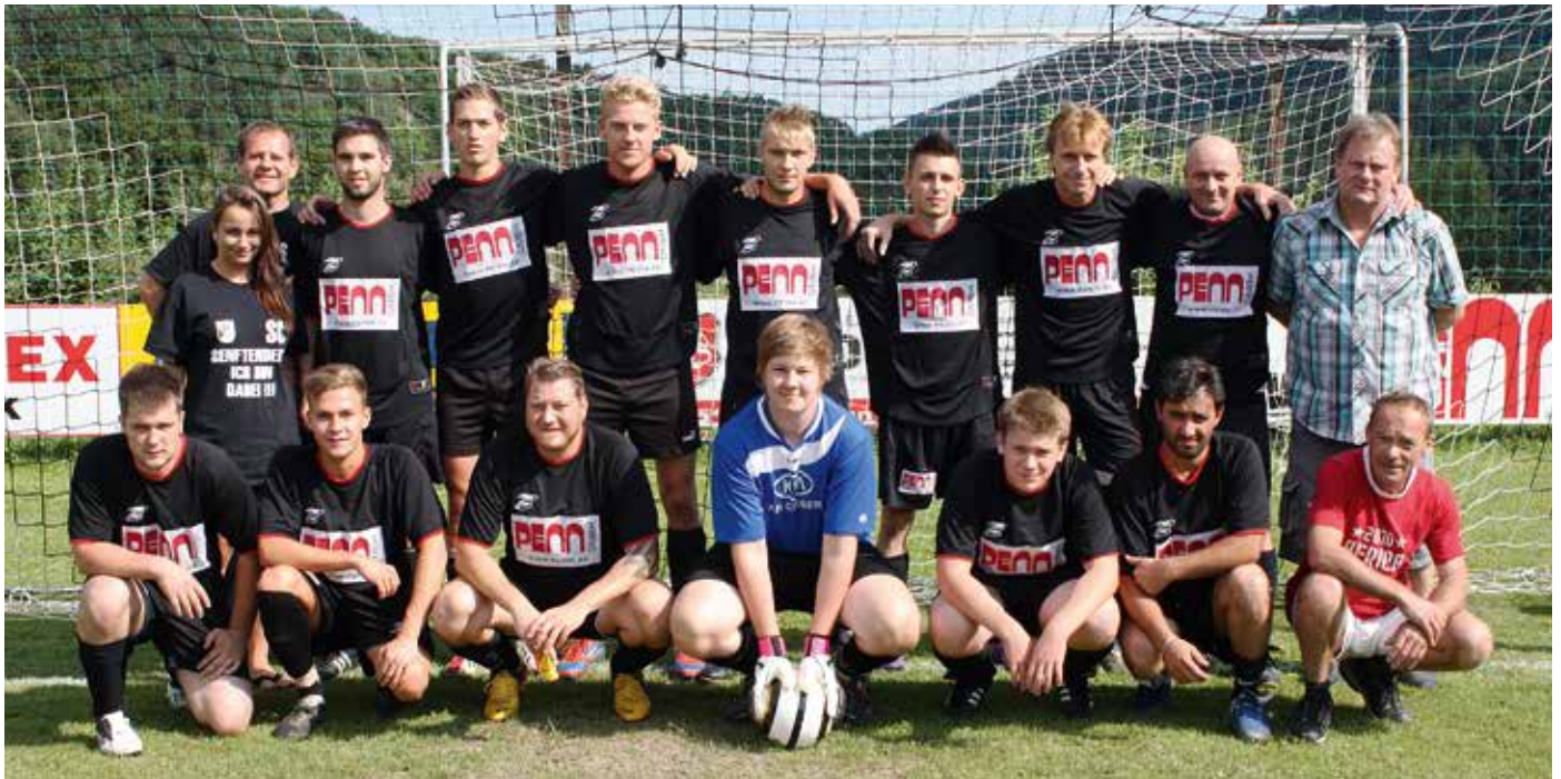
Die U 23 Mannschaft des SC Senftenberg.

Licht und Schatten wechselten im Herbstdurchgang beim SC Senftenberg. Auf wirklich gut gespielte Partien, vor allem gegen die Mannschaften im vorderen Tabellendrittel, folgten schwächere Spiele gegen unmittelbare Tabellenachbarn, wo wichtige Punkte oft in den letzten Spielminuten verloren gingen.