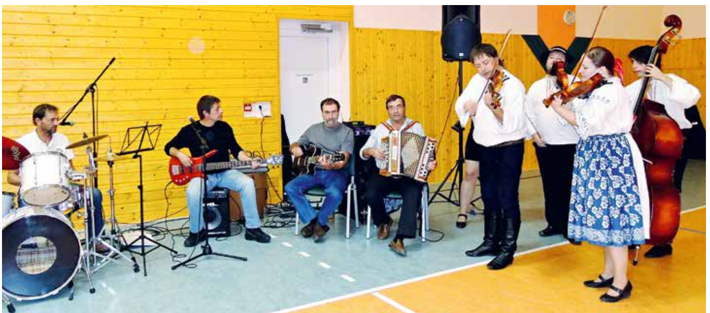
Fam. Braun musiziert mit Musikanten aus Tschechien