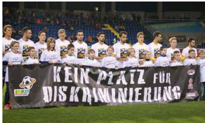
Die U 12 als Begleitkinder des SKN St. Pölten.

Der Vorstand des SCS wünscht allen Spielern, Sponsoren und der Bevölkerung von Senftenberg fröhliche Weihnachten und ein erfolgreiches Jahr 2014.