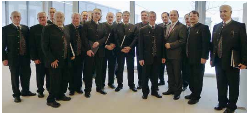
LH-Stv. Mag. Wolfgang Sobotka bei seinem „Auftritt“ mit dem Männerchor Senftenberg am 26.02.2013 noch in der Baustelle im neuen Heurigenlokal „Weinblick“ Grafinger in Priel.