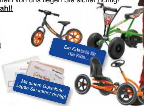
Ein Erlebnis für die Kids... Mit einem Gutschein liegen Sie immer richtig!