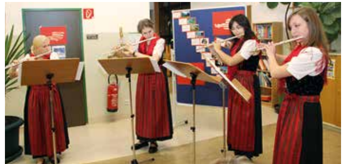
Die musikalische Umrahmung durch das Querflötenquartett.