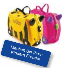
Machen Sie Ihren Kindern Freude!