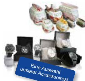
Eine Auswahl unserer Accessoires!