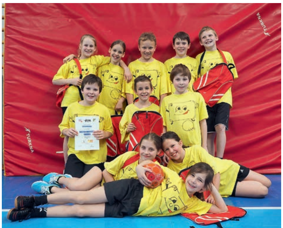
4. Klasse: Handball-Turnier in der Sporthalle Krems