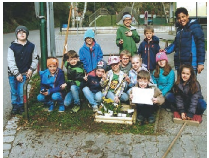
2. Klasse – Frühlingserwachen