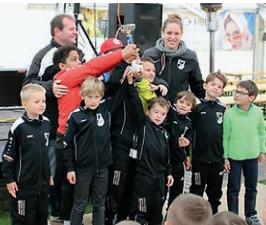
Zweiter Platz beim Pfingstturnier in Albrechtsberg.