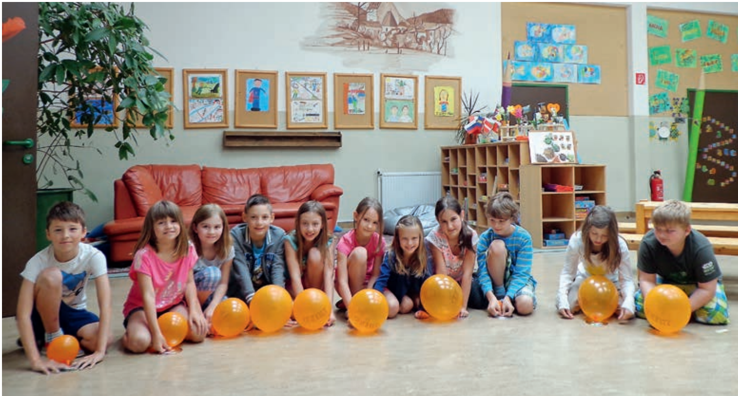
Experiment der 3. Klasse: „Luftschiffboote“ schweben durch die Aula.

Das Schuljahr 2015/16 neigt sich dem Ende zu und in Dankbarkeit blicken wir auf ein erfolgreiches Jahr zurück.