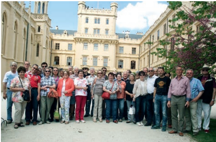
Gruppenfoto vom Vereinsausflug ins Weinviertel

soren der Senftenberger Wirtschaft. Durch das äußerst positive Feedback zu dieser Veranstaltung wird die Planung für den nächstjährigen Termin bereits vorbereitet.