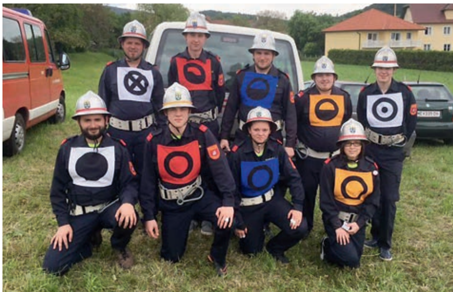
Die Wettkampfgruppe der FF Imbach in Maria Laach.