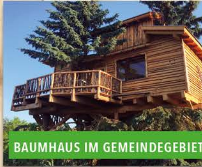
BAUMHAUS IM GEMEINDEGEBIET