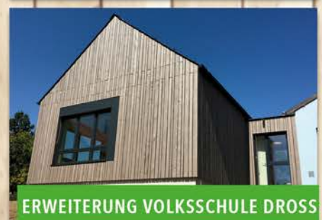
ERWEITERUNG VOLKSSCHULE DROSS