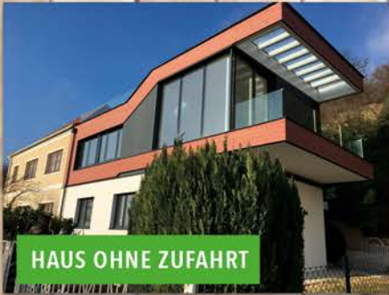
HAUS OHNE ZUFABRT