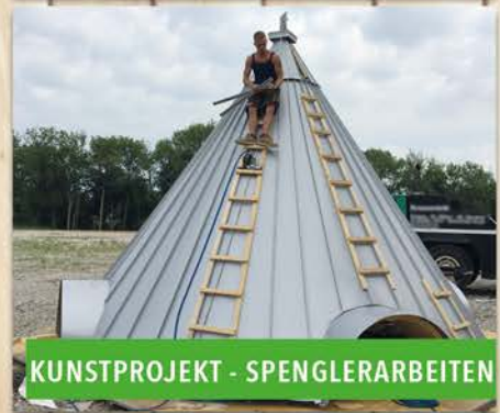
KUNSTPROJEKT - SPENGLERARBEITEN