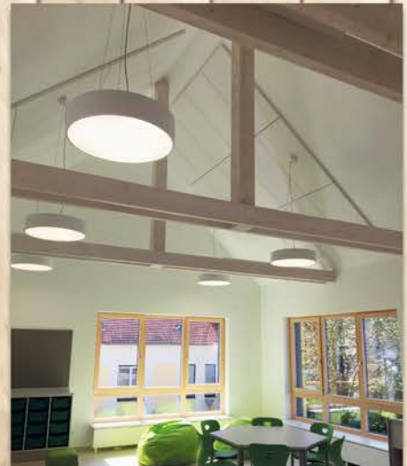
TAGESBETREUUNGSSTÄTTE VS DROSS