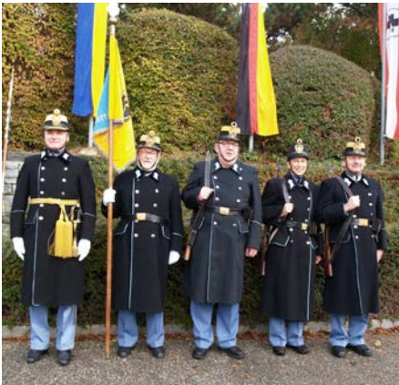
1. November 2016, Abordnung der Hessergerde in Exerzieruniform zu Allerheiligen in Imbach und Senftenberg

Neben zahlreichen Ausrückungen des Senftenberger Traditionsvereines in unserem Bundesland, war die Teilnahme einer Abordnung der Hessergerde Senftenberg an den Feierlichkeiten, anlässlich des 150. Jahrestages der Seeschlacht bei Lissa, ein ganz besonderes Erlebnis. Die militärisch bedeutende Insel wird auch „das Gibraltar der Adria“ genannt. Nach 15 Stunden Fahrzeit ab Wien (davon zweieinhalb Stunden mit dem Schiff ab Split) erreichten wir die Insel Lissa, die heute Vis heißt.