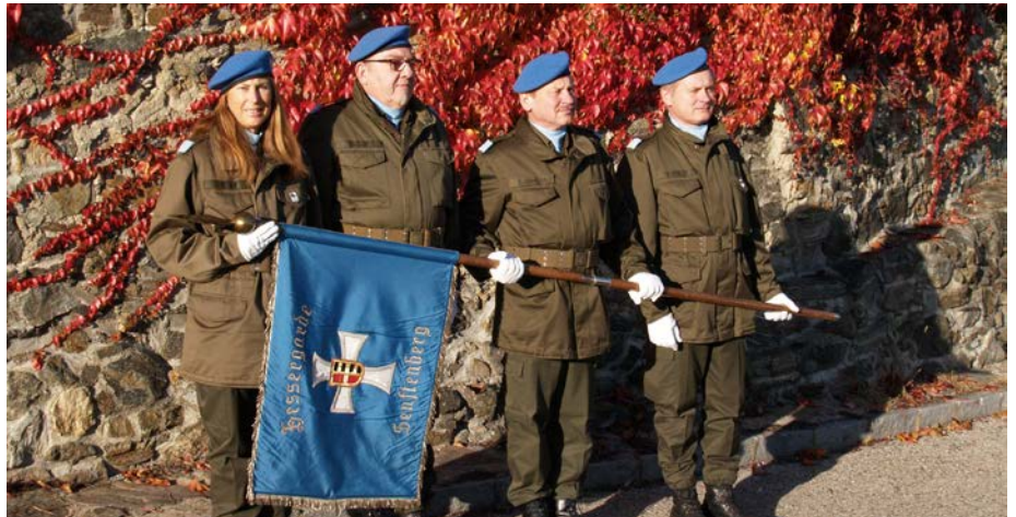
26. Oktober 2016, das IR 49 bei der Gedenkfeier am Soldatenfriedhof in Oberwölbling

Eine Vielzahl von Traditionsregimentern aus den ehemaligen Kronländern (darunter das Infanterieregiment 49, Hessergerde) nahm in ihren Traditionsuniformen an den Feierlichkeiten teil. Die derzeitigen Flottenadmiräle der italienischen und kroatischen Kriegs-