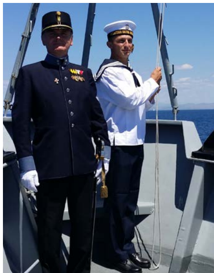
20. Juli 2016, der Kommandant der Hessergerde und ein Matrose der kroatischen Marine