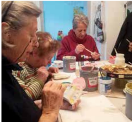
Senioren entdecken künstlerische Ader beim Töpfern im Laden am Fluss.