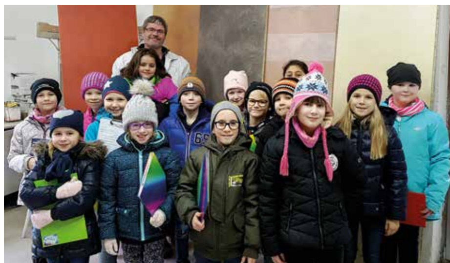
Besuch der 3. Klasse der Volksschule im Malerbetrieb Jokesch.