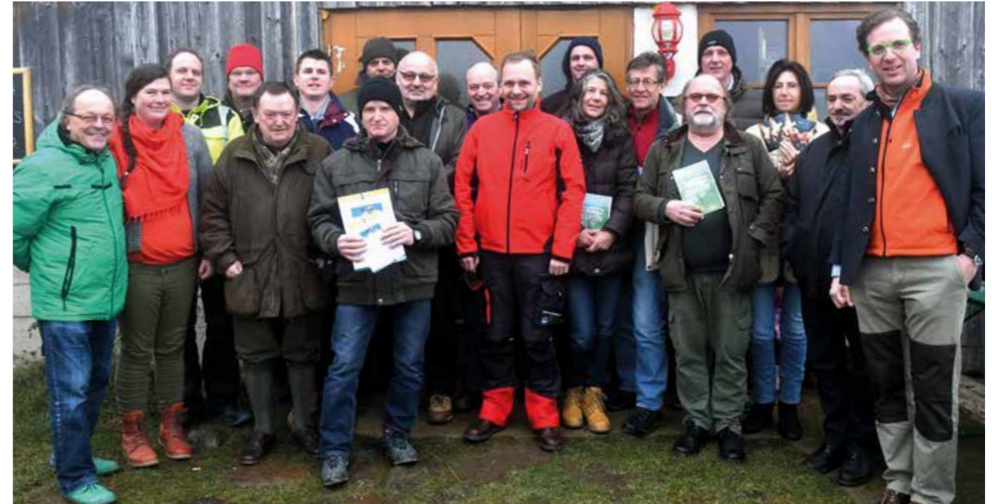
Großes Interesse herrschte am Obstbaumschnittkurs. Weitere Termine in Vorbereitung

Der Verein LEADER-Region Kamptal arbeitet seit 2 Jahren engagiert daran, dass der Bestand an Streuobstbäumen im östlichen Waldviertel erhalten bleibt und gut gepflegt wird. Dafür wurden im Februar und März sechs Schnittkurse organisiert. Einer fand am Biobauernhof Resch im Reichaueramt statt. 16 Interessierte nahmen teil und lernten in Theorie und Praxis was beim richtigen Schnitt zu beachten ist. Erste Erfahrungen konnten beim Schneiden der Jung- und Altbäume vor Ort gemacht werden.