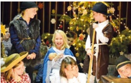
Vor den Ferien gab es ein wunderschönes Weihnachtsfest mit zahlreichen Gästen.

Technische Aufrüstung: In der Volksschule freut man sich auch über die Anschaffung eines neuen PC für das Lehrerzimmer sowie eines Laptops für die Lehrer durch die Gemeinde. Auch hierfür bedanken sich Schulleitung und Lehrer recht herzlich.