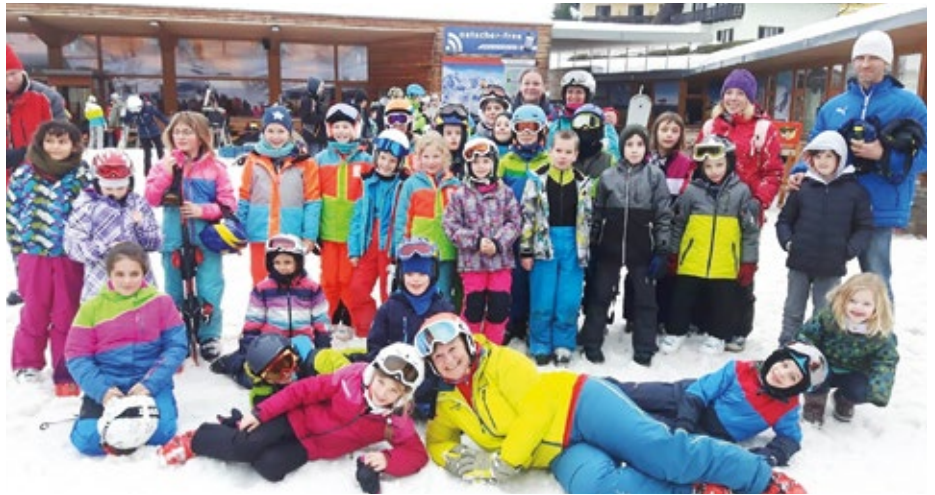
Am 20. Februar verbrachten die Schülerinnen und Schüler einen schon traditionellen Schitag in Lackenhof.

Schulsportgütesiegel: Für zahlreiche Aktivitäten in den Bereichen Bewegung, Sport und Gesundheitserziehung erhielt die VS Senftenberg für das Schuljahr 2017/18 das Schulsportgütesiegel in Bronze. Die feierliche Überreichung der Urkunde fand am 27. Februar in