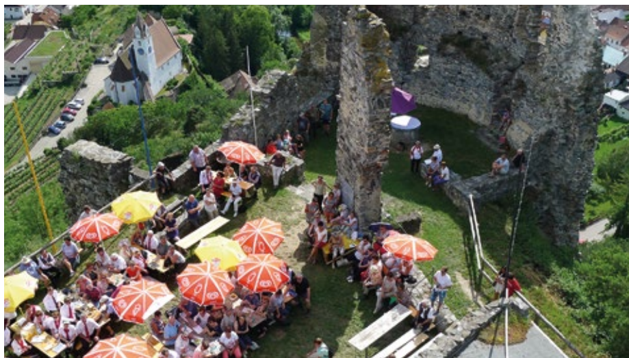
Das „Singen auf der Burg“ findet heuer am Sonntag, dem 16. Juni, statt.

Das traditionelle „Singen auf der Burg“ wird mit Gastchören aus Schiltern und Lengelfeld am Sonntag, 16. Juni, um