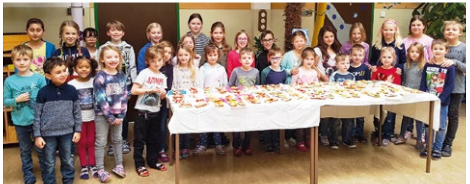
Im Sinne der Nahtstelle Kindergarten-Volksschule luden die Kinder der vierten Klasse die zukünftigen Schulanfänger zu einem Besuch ein. Gemeinsam schnitten sie Gemüse, strichen Brote und verspeisten sie dann anschließend in der großen Pause.