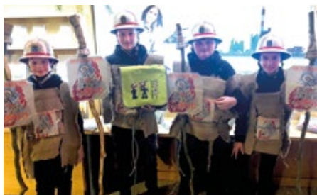
Faschingsfeier: „Die Feurigen Vier“.