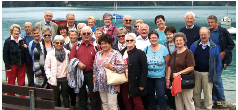
Ganztagesausflug des Seniorenbundes nach Salzburg.

Im Juni organisierte der Seniorenbund Senftenberg einen Ganztagesausflug nach Salzburg. Am Vormittag nahmen die TeilnehmerInnen an einem interessanten und auch amüsanten Vortrag über „Gesundes Schlafen“ bei der Firma Wenatex teil. Am Nachmittag