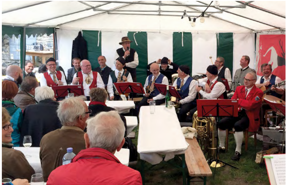
Im Rahmen des Viertelfestivals trafen auf der Burgruine Kremstaler aus Ober- und Niederösterreich musikalisch aufeinander.

Planung oberer Burghof: Durch den Blitzeinschlag im letzten Jahr und die Bautätigkeiten für die Aussichtsplattform ist der obere Burghof sanierungsbedürftig. Auch der trockene Sommer hat seine Spuren hinterlassen. Wir überlegen derzeit, wie wir den Burghof verschönern können. Einerseits soll es weiter möglich sein, Feste zu feiern, andererseits soll die Harmonie zwischen