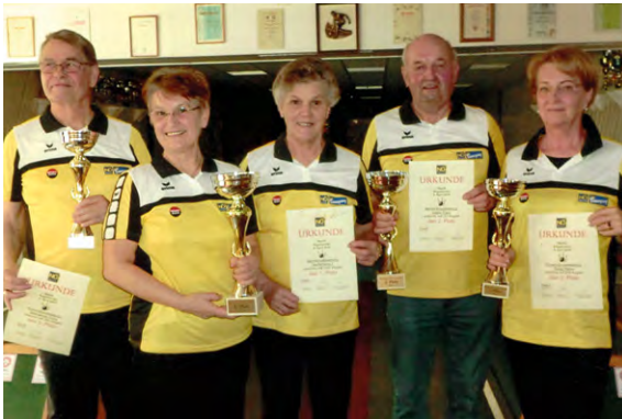
Erfolgreiche Kegler aus Senftenberg.