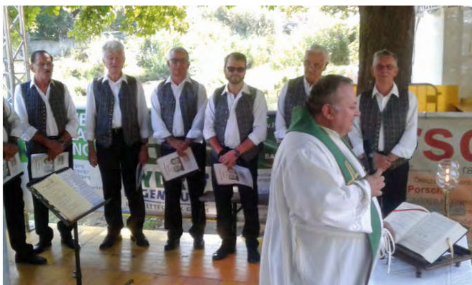
Parkfest: Der Männerchor gestaltete die Feldmesse.

Mit der musikalischen Umrahmung der Feldmesse am Sonntag, 19. August 2018 im Rahmen des Parkfests in Senftenberg startete für den Männerchor Liedertafel Senftenberg die zweite Jahreshälfte. Ab September finden wieder jeden Montagabend die Proben statt. Am Programm stehen altbekannte Wein- und Heimatlieder. Ein Termin für eine Weintaufe wurde bereits fixiert. Danach werden wir uns auf die Adventkonzerte im Dezember vorbereiten, damit auch dafür das musikalische Repertoire aufgefrischt wird.