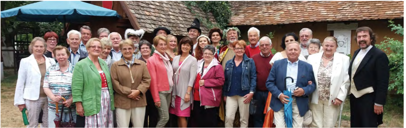
Ausflug ins Weinviertel: Auf dem Programm stand unter anderem ein Operettenbesuch im Romantik-Theater Untermarkersdorf.