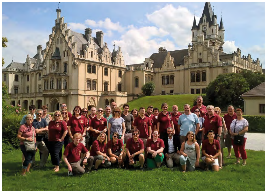
Musikerausflug zum Schloss Grafenegg und Schloss Traismauer.

Parkfest: Das alljährliche Parkfest wurde heuer durch den Weinstand der Trachtenkapelle bereichert. Ausge-