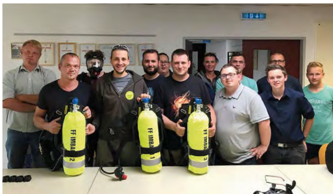
Atemschutzgeräte neu: Einschulung durch Firma Dräger.