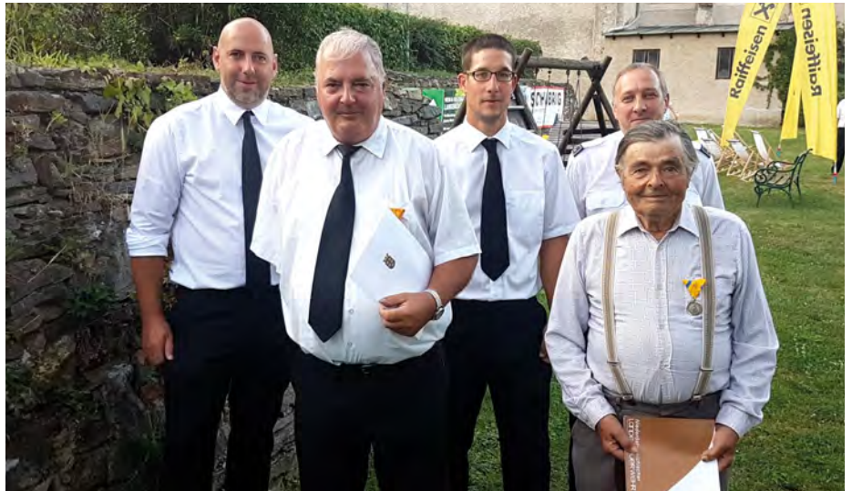
Ehrungen für verdiente und langjährige Feuerwehrmitglieder der FF Priel beim Abschnittsfeuerwehrtag in Imbach.

In Niederösterreich sind mehr als 98.000 Feuerwehrmitglieder in 1.630 Freiwilligen und 89 Betriebsfeuerwehren tätig. Sie leisten jährlich mehr als 60.000 Einsätze im Kampf gegen Feuer, Katastrophen und bei Unfällen. „Niederösterreich ist das Land der Freiwilligen. Die Hilfs- und Einsatzbereitschaft, aber auch das Engagement unserer Freiwilligen ist für unsere Gemeinschaft unverzichtbar“, so Pernkopf.