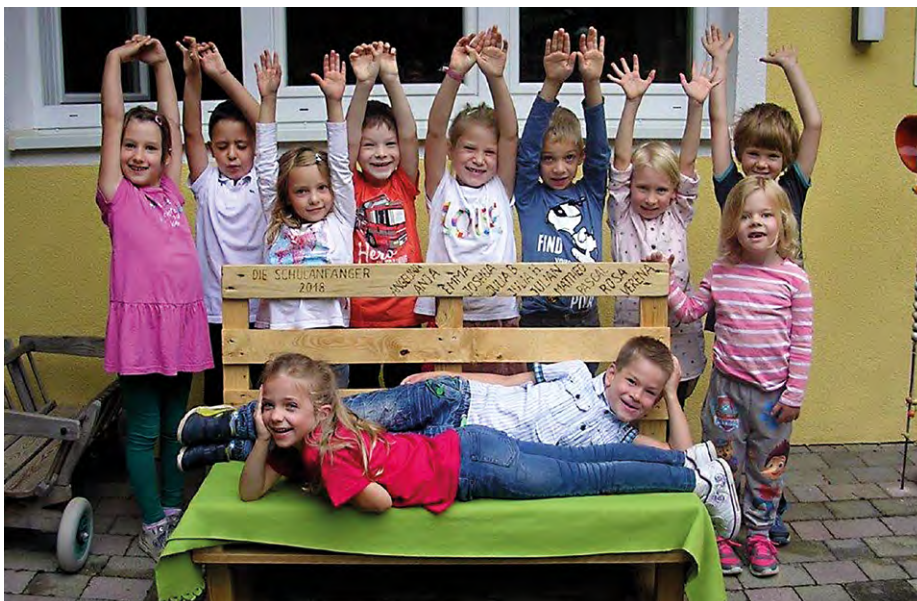
Schulanfänger: Die Eltern der „Schulanfänger 2018“ schenkten dem Kindergarten eine Palettenbank. Da die Namen der Kinder darauf verewigt sind, behalten wir diese noch lange in Erinnerung. Danke den Eltern für diese Idee.