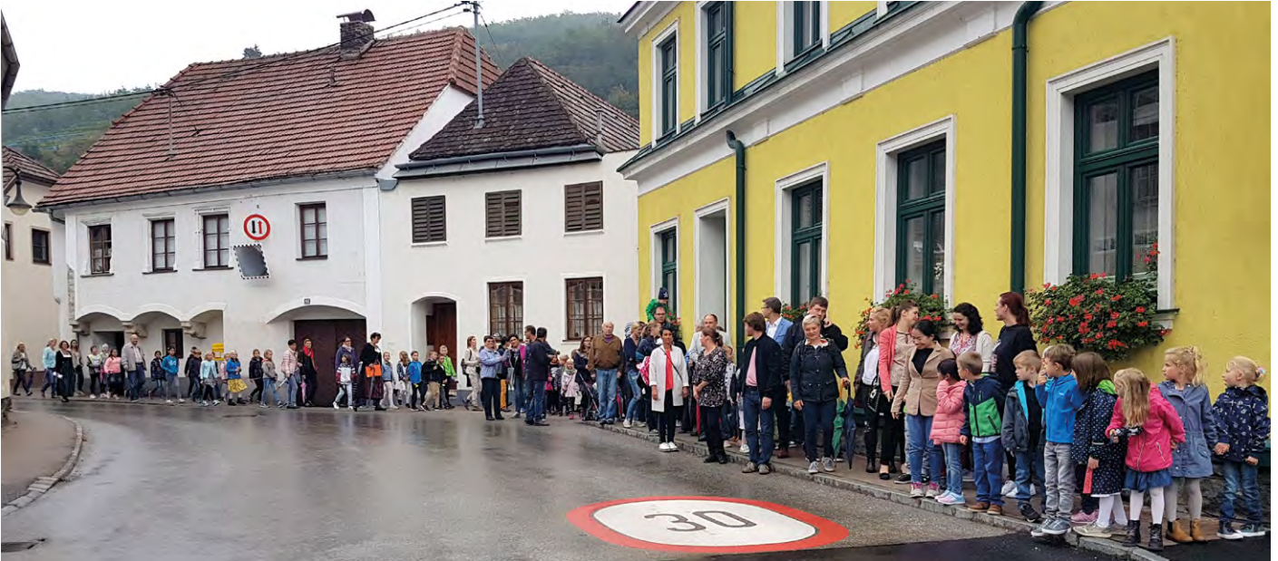
Start in das neue Schuljahr mit dem traditionellen Gang zur Schulmesse.

Schulbeginn: Am 3. September öffneten nach neun Wochen Ferien endlich wieder die Türen der Volksschule in Senftenberg. Mit großer Spannung fieberten diesem Schulstart nicht nur die Kinder, sondern auch viele Eltern entgegen. Da sich Oberschulrätin Brigitte Königberger zu Schulschluss in den wohl-