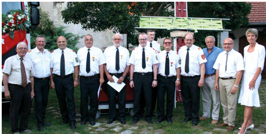
Auszeichnungen gab es für verdiente und langjährige Feuerwehrmitglieder beim Abschnittsfeuerwehrtag in Imbach.