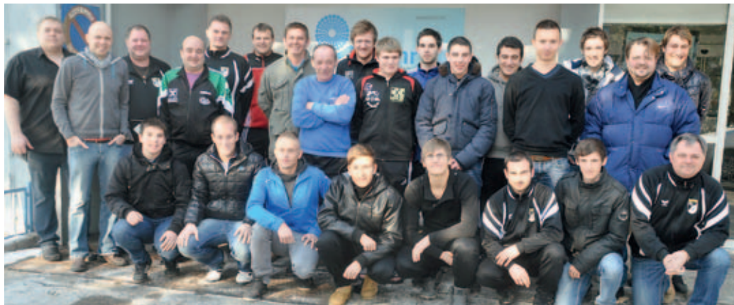
Frühjahrsvorbereitung im Nuhr Medical Center

Am 3. März 2012 begann für den SC Senftenberg die Frühjahrsaison. Im Lokalderby gegen Lengsfeld gab es ein mehr als gerechtes 1:1 Unentschieden. Vor allem in der ersten Halbzeit konnten die Heimischen mehrere hochkarätige Chancen nicht nutzen. Auch im zweiten Spiel in Mautern war der SCS 60 Minuten die bessere Mannschaft, konnte aber die Überlegenheit nicht in Torerfolge umsetzen. Da kurz vor Schluss eine große Ausgleichschance vergeben wurde, setzte es eine