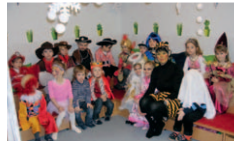
Los geht es mit ein paar Eindrücken vom heurigen Fasching