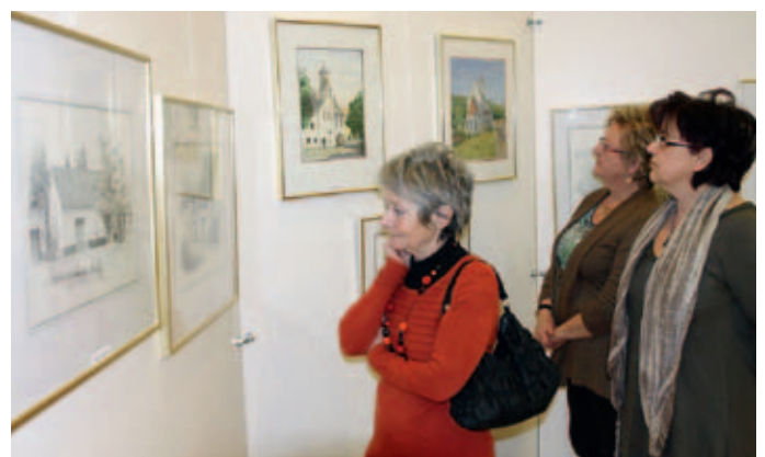
Senftenbergerinnen beim Rundgang durch die Ausstellung