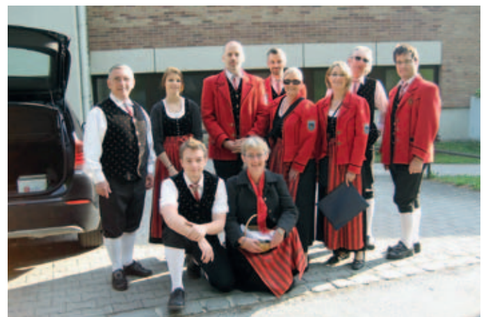
Tag der Blasmusik