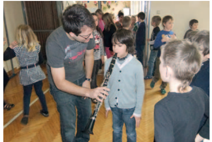
Vorstellung der Instrumente

Am 17. Februar besuchten einige Musiker des Vereins die begeisterten und wissbegierigen Schüler der VS Rehberg. Die SchülerInnen aller 4 Schulklassen hörten unseren Erklärungen zum Erlernen eines Instrumentes genau zu