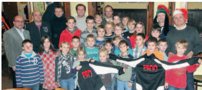
Nachwuchsweihnachtsfeier im Gasthaus Braun

dankt sich beim Nuhr Medical Center für die zur Verfügung Stellung der Umkleiden und für die Einladung in die Sauna sowohl für die Erwachsenen als auch für die U 10 Mannschaft. Weiters bedanken wir uns beim Gasthaus Braun für die Unterstützung zur Nachwuchs-Weihnachtsfeier und bei Firma Penn für die Spende der Trainingsanzüge für die jungen Spieler. Die Patronanz über das erste Frühjahrsspiel übernahm J. Teichtmeister von der Firma Famot. Unser Dank gilt auch Herrn Dipl.-Ing. Pressler von den Wachauer Sammlerfreunden, die einen Teil des Ertrags dem SC Senftenberg zur Verfügung stellten. Abschließend bedanken wir uns bei Weinbau Eichelmann für die Bereitstellung der Hütte und bei Familie Koller und der Raiffeisenbank Senftenberg für die „Stromspende“ für den weihnachtlichen Glühweinstand.