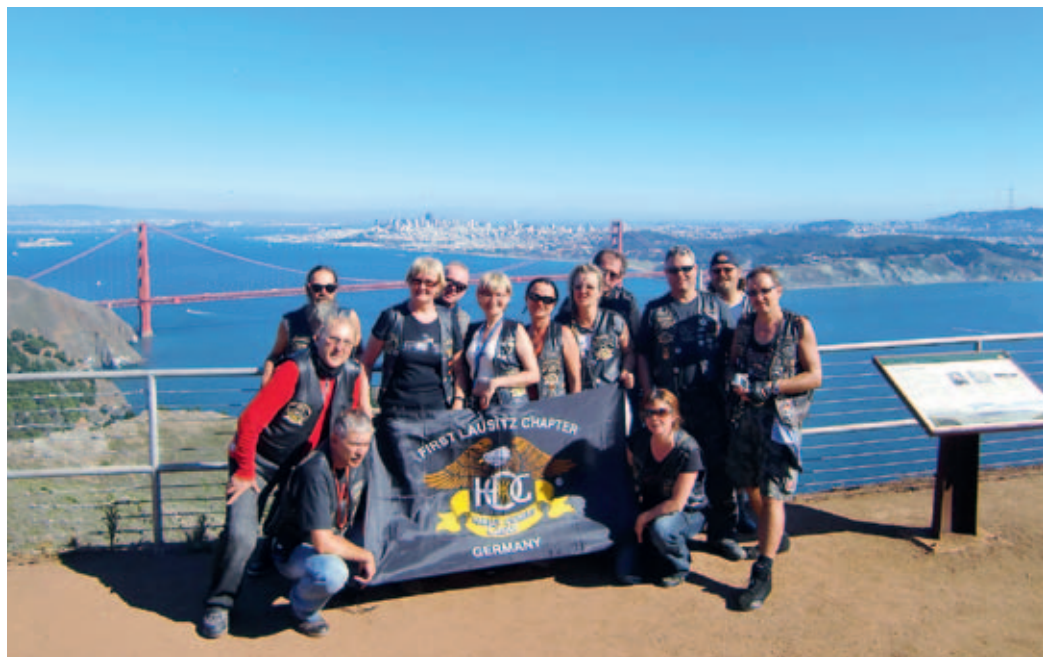
Abordnung des First-Lausitz-Chapters in San Francisco