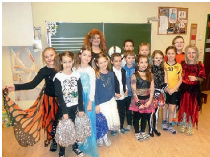
Faschingsdienstag in der Volksschule 17. Februar 2015

Das erste Halbjahr dieses Schuljahres ist vorbei! Alle Kinder unserer Schule haben das 1. Semester erfolgreich abgeschlossen.