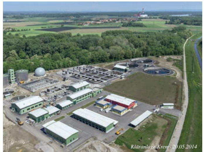
Kläranlage Krems 20.05.2014

Der Verband wurde im Jahr 1974 mit 4 Gemeinden gegründet. Seit dem Jahr 2008 hat der Verband 18 Mitglieder. Mit kostengünstigen Übergangsmaßnahmen konnte die Lebensdauer der alten Kläranlage über die rechnerische Lebensdauer hinaus ausgedehnt und die Kapazität für den Beitritt der weiteren Gemeinden erhöht werden. Nach 37 Jahren war jedoch endgültig Schluss! Den Gemeindebürgern konnte somit fast ein kompletter Kläranlagenumbau in den 1990-iger Jahren erspart werden. Im Zuge der Errichtung der neuen Kläranlage wurde auch die Gewinnung von Alternativenergie wesentlich forciert. So wird das durch den Klärprozess anfallende Faulgas mittels Blockheizkraftwerken verstromt und die Abwärme für Heizzwecke ver-