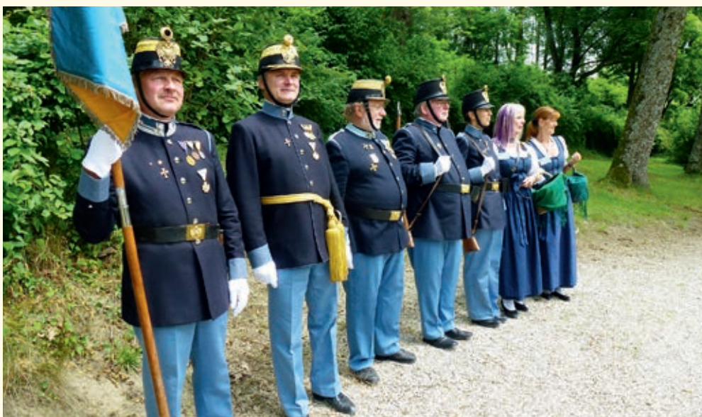
Abordnung der Hessergarde Senftenberg bei der Gedenkfeier auf Schloss Artstetten anlässlich des 100. Jahrestages der Ermordung des Thronfolgers Franz-Ferdinand in Sarajewo.