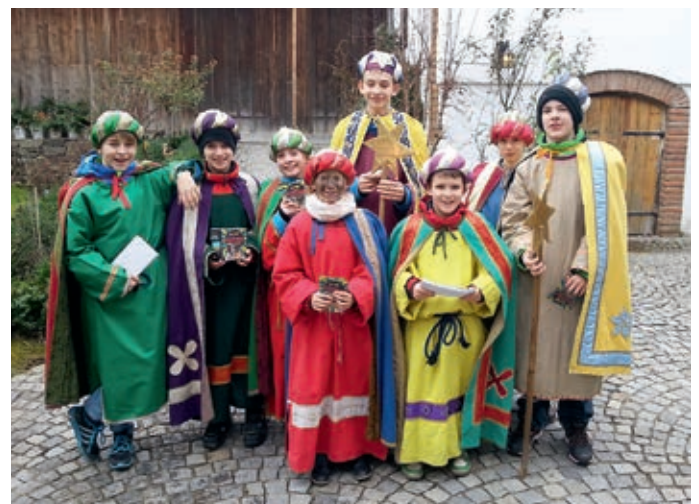
Wie jedes Jahr waren auch heuer wieder acht Kinder aus Priel im Rahmen der Sternsingeraktion unterwegs. Sie wurden überall herzlich empfangen. Der Einsatz hat sich gelohnt: 823 Euro kamen als Reinerlös für Hilfsprojekte zusammen.