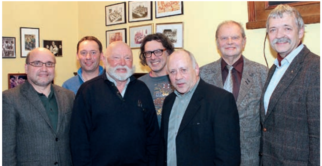
Der neue Vorstand Senftenberg

An die sechzig Hochzeiten und zahlreiche Familien- und Firmenfeiern sorgten neben der Werbewirksamkeit dafür, dass der Verein finanziell gut abgesichert ist, um attraktive Projekte in den kommenden Jahren umsetzen zu können.