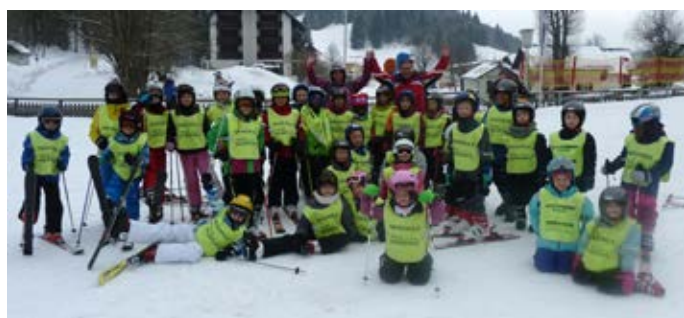
Schitag auf den Pisten des Ötschers in Lackenhof