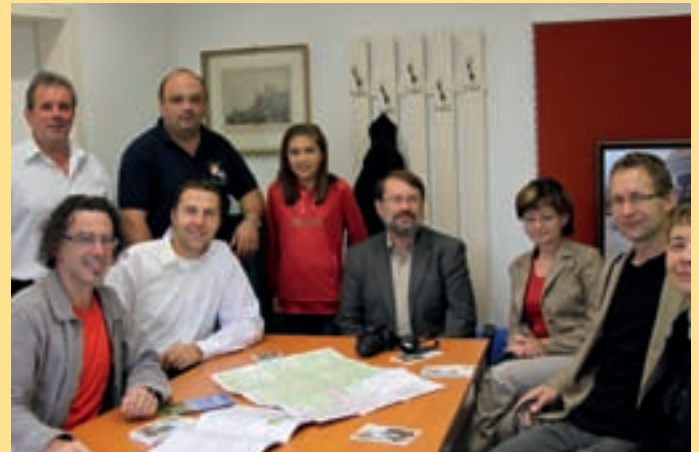
Gemütliche Runde im Rathaus Senftenberg.