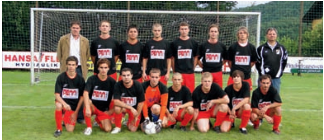
Die SCS-Kampfmannschaft in der heurigen Meisterschaft.

Beim Nachwuchs nimmt der SCS gemeinsam mit Gföhl mit einer U 9, U 11 und U 16 Mannschaft an der Meisterschaft teil.