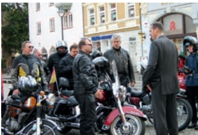
Am ersten Aufenthaltstag wurden die Biker vom Bürgermeister der Stadt Senftenberg empfangen, der die besten Grüße nach Senftenberg/NÖ mit auf den Weg gab.