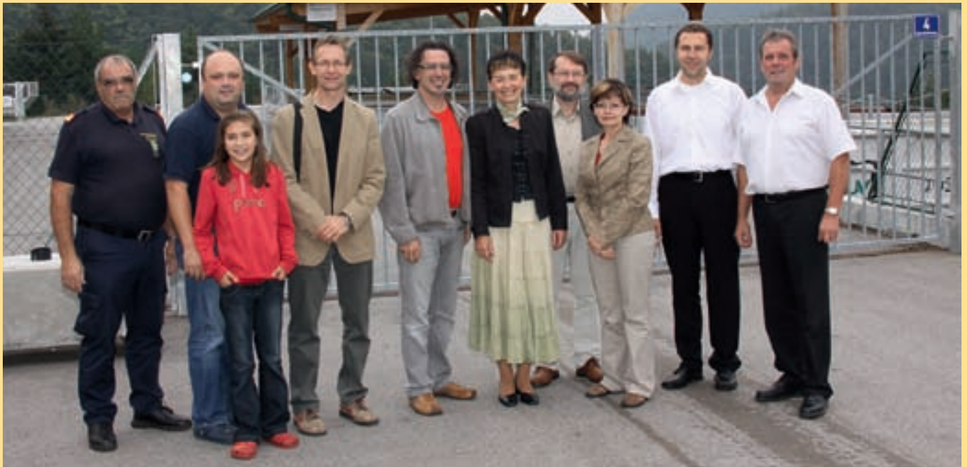
Besichtigung des ASZ und KS-Lagers beim Sportplatz