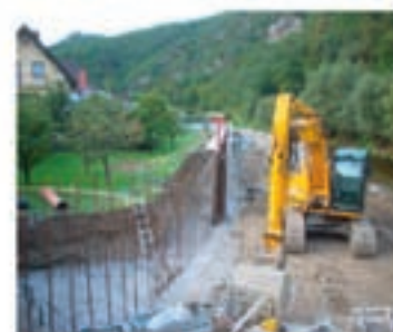
Hochwasserschutzmaßnahmen an der Krems im Bereich Alt- und Botental

Biomasse-Nahwärmeanlagen Laboruntersuchung Altstoffsammelzentren Siedlungswasserbau Klärschlamm Entsorgung Technische Gebäudeausrüstung