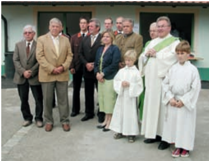
Die Ehrengäste anlässlich der Weihe des Mehrzweckgebäudes.