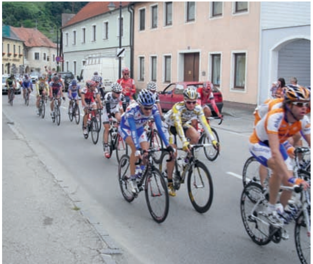
Die 61. Österreich-Radrundfahrt führte in diesem Jahr auch durch Senftenberg.

Die drei Ausreißer mussten in Senftenberg, Bereich „Boten-