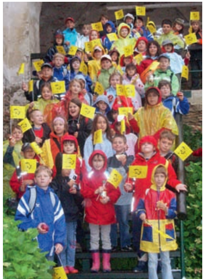
Der Elternverein VS Senftenberg bedankt sich für die vielen Spenden und Ihre Mitarbeit im Schuljahr 2008/2009. Zahlreiche Veranstaltungen wie die Nikolausfeier, der Kinderfasching sowie die Abschlussfahrt aller Klassen zur Rosenburg mit Führung und Falkenshow wurden organisiert und Lehrmaterialien in der Höhe von € 1.229,74 angeschafft. Wir bedanken uns für das Sponsoring der Raiffeisenbank Krems, Bankstelle Senftenberg. Der Vorstand