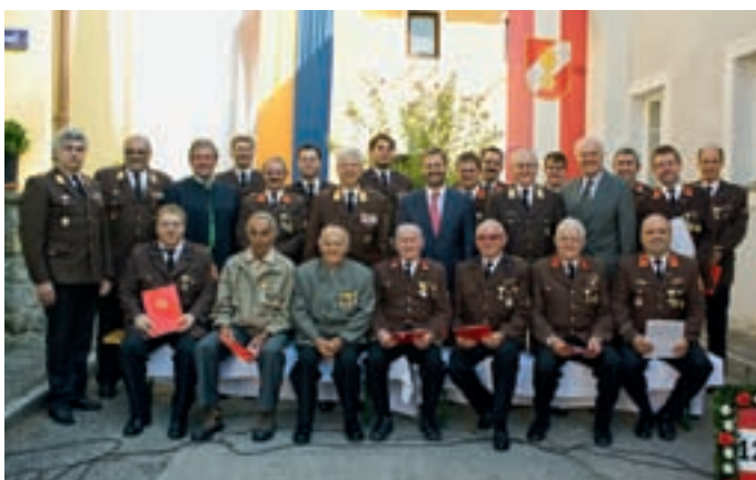
Ehrungen beim Abschnittsfeuerwehrtag in Imbach

HOME PAGE unserer Feuerwehr: www.ff-senftenberg.at