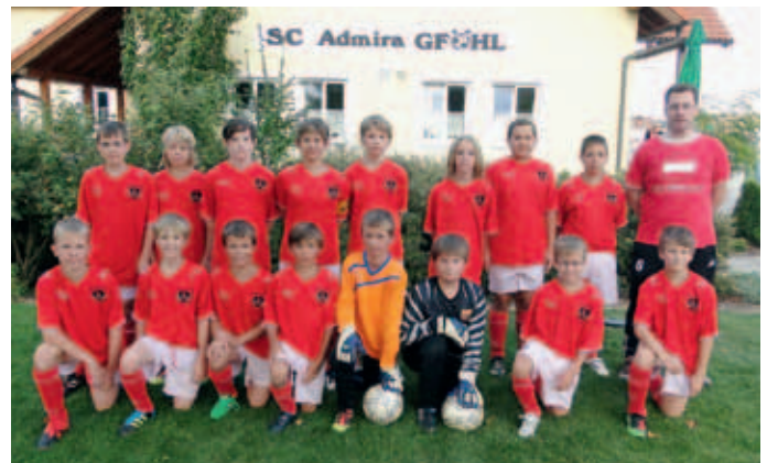
Die erfolgreiche U 13 der SC Senftenberg/Gföhl