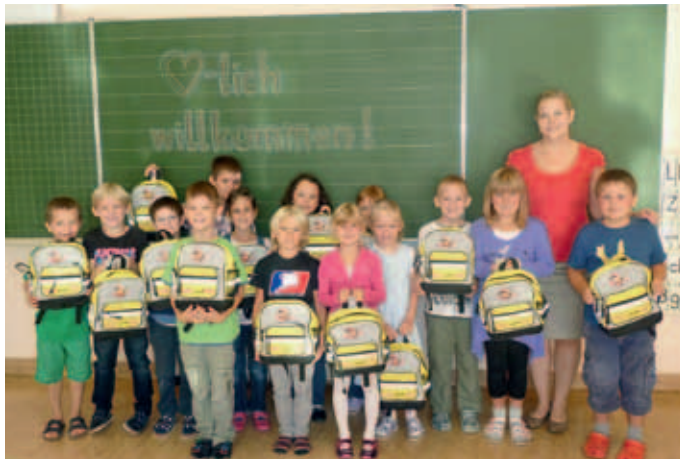
Dank an die Raiffeisenbank Senftenberg für die Überreichung des Geschenkes an unsere 14 Taferlklassler.