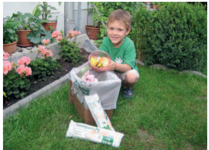
Vorsammelsäcke sind die saubere Lösung bei der Biosammlung

Weitere Infos unter www.gvkrems.at oder beim Abfalltelefon unter 02734/32333-33.