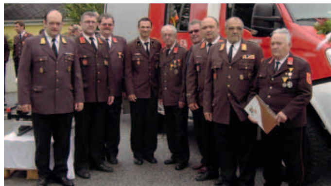
Abschnittsfeuerwehrtag in Nöhagen

HOME PAGE unserer Feuerwehr: www.ff-senftenberg.at