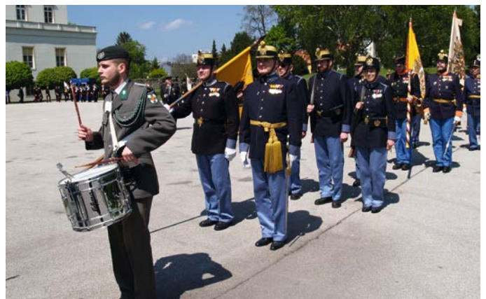
05. Mai 2017, Militärparade der Traditionsregimenter auf der MilAK in Wr. Neustadt zum 300. Geburtstag von Kaiserin Maria Theresia.