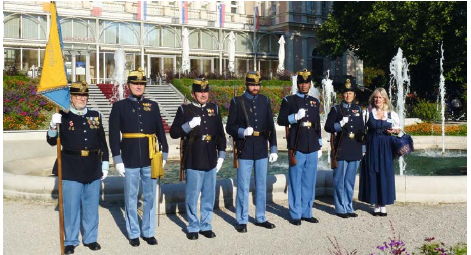
18. August 2017, Abordnung der Hessergarde Senftenberg zu Kaisers Geburtstag in Bad Ischl.

Viele weitere Ausrückungen betrafen Schießveranstaltungen, traditionelle kirchliche Veranstaltungen, Begräbnisse, Angelobungen des Bundesheeres und Arbeitssitzungen.