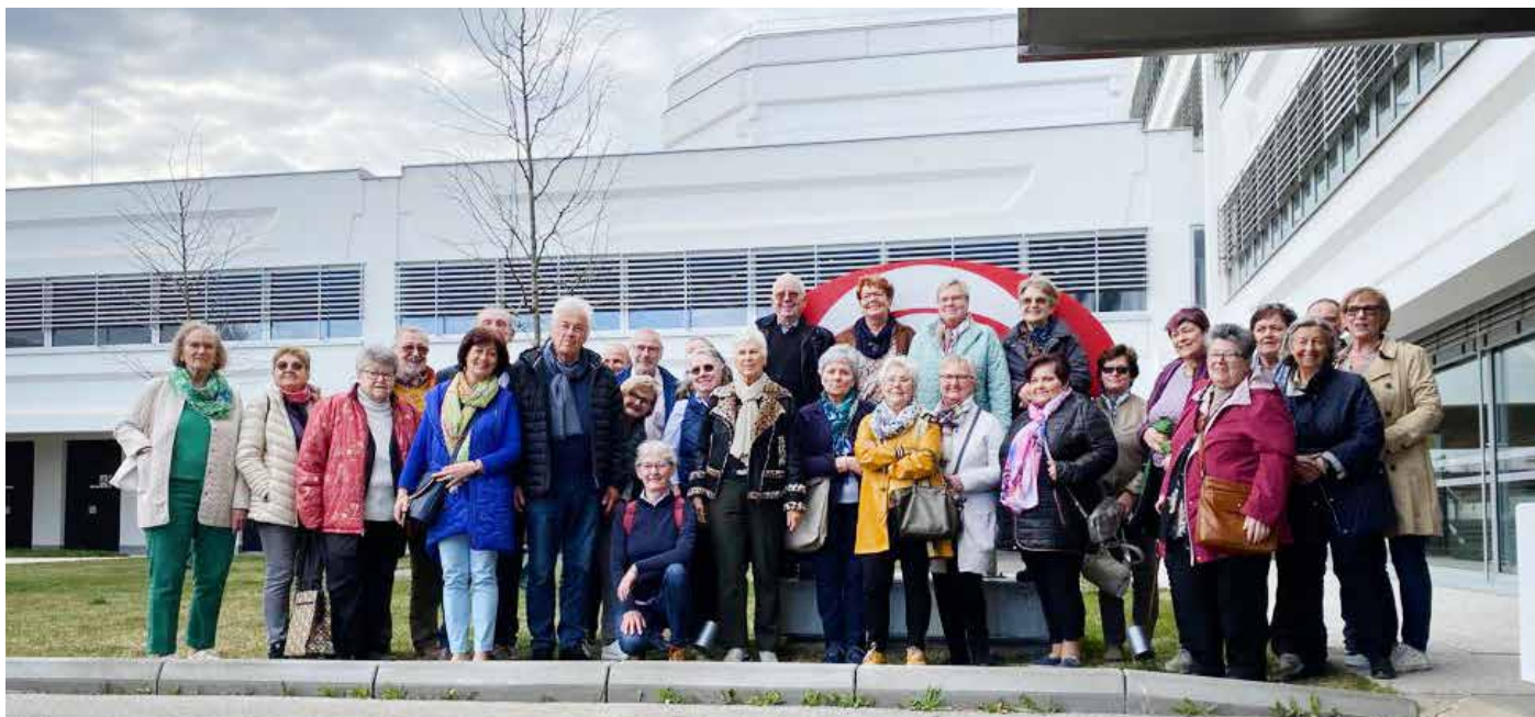
Ein Ausflug brachte die SeniorInnen nach Wien und zum ORF, wo man auch die Aufzeichnung von „Was gibt es Neues“ besuchte.

Die NÖ Senioren Senftenberg waren wieder sehr aktiv und erfolgreich.