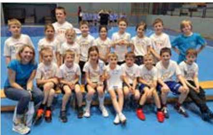
Zweiter Platz beim Mattenhandballturnier für die 2. Klasse.

Workshop Spinnentiere: Die Workshopangebote des Ministeriums in Kooperation mit dem Naturhistorischen