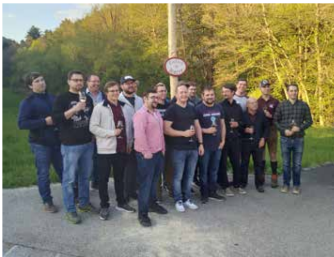
Zahlreiche helfende Hände trugen zum Gelingen des Festes bei.