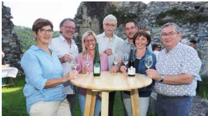
Beim „Weingenuss zwischen Himmel und Erde“ bot sich wieder hervorragend Gelegenheit zum Verkosten, Fachsimpeln und um entspannte Stunden zu genießen.

Und nicht zu vergessen ist die Presse, die vor und nach dem Weingenuss zwischen Himmel und Erde sehr positiv mit vielen Fotos berichtet hat.