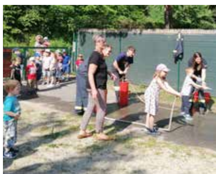
Abenteuer pur: Volksschul- und Kindergartenkinder verbrachten ein paar aufregende Stunden mit der FF Senftenberg.

Es werden den Jugendlichen feuerwehrfachliche Kenntnisse spielerisch übermittelt. Die erlernten Fertigkeiten (z. B. Erste Hilfe, Knotenkunde usw.) finden nicht nur alleine im Feuerwehrwesen Verwendung! Vor allem aber soll den Jugendlichen die Gemeinschaft und Freude am Feuerwehrleben vermittelt werden. Die Feuerwehrjugend ist ein guter Ausgleich zum Schulalltag. Spiel & Spaß kommen auch nicht zu kurz und sie bietet vor allem eine gute Gelegenheit neue Freunde zu finden.