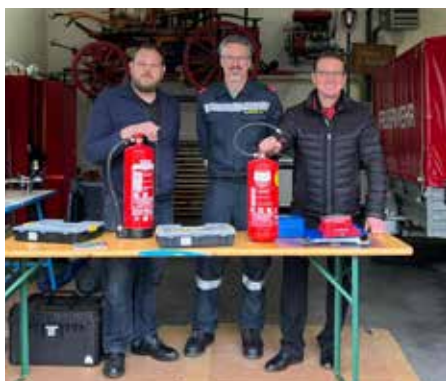
Mehr als 70 Feuerlöscher wurden im Feuerwehrhaus überprüft.

Maibaum aufstell'n: Bei stimmungsvoller Atmosphäre, angenehmem Wetter und sehr gutem Besuch wurde auch in diesem Jahr der Tradition entsprechend wieder ein Maibaum gesetzt. Dabei wäre die Veranstaltung beinahe ins Wasser gefallen. Denn der Hauptprotagonist (Maibaum) war kurzerhand nach Droß verschwunden. Nach der Entrichtung eines Obolus konnten die Prieler FF-Kameraden diesen aber wohlbehütet und unbeschadet wieder übernehmen.