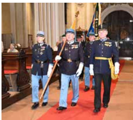
Regimentsgedenktag des IR49, Feier im Dom der Wachau am 14. Mai 2023.