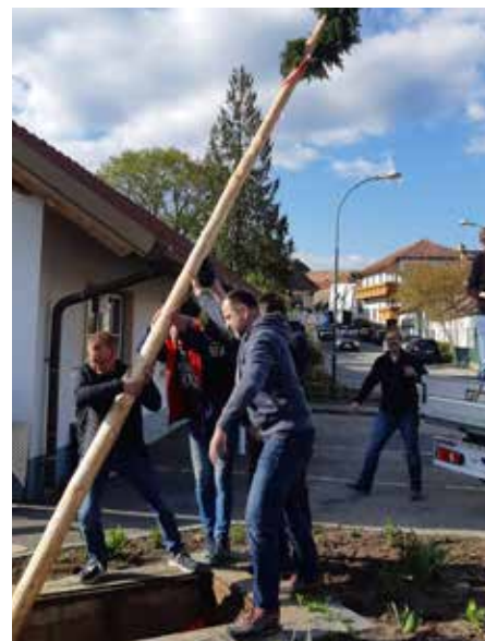
Den „Ausflug“ nach Droß hat der Maibaum gut überstanden.

Feuerlöscher-Überprüfung: Die Überprüfung von Feuerlöschern ist alle zwei Jahre verpflichtend vorzunehmen. Aus diesem Grund wurde heuer wieder die Möglichkeit geschaffen, dies auf