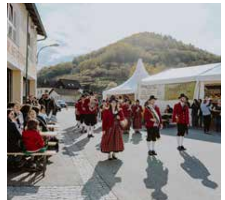
Maibaumsetzen in Senftenberg.