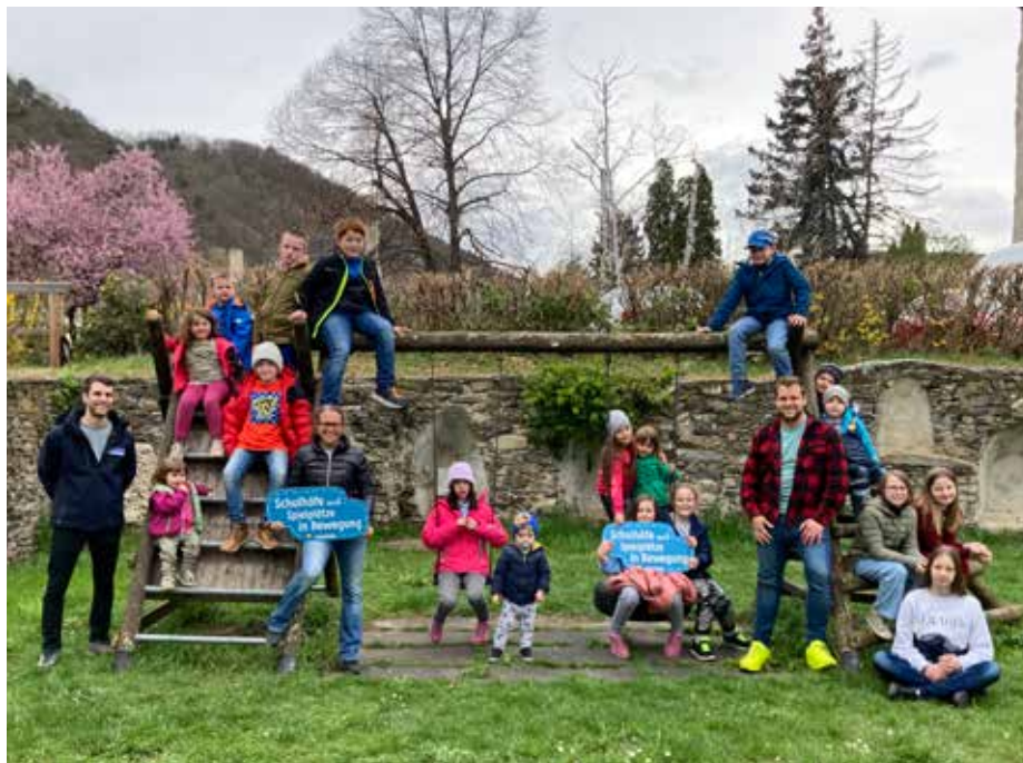
Die Imbacher Kinder waren mit Feuereifer bei der Planung ihres Spielplatzes dabei.

In einem Wettbewerb vom NÖ Spielplatzbüro wurde Senftenberg als eine von zehn Gemeinden ausgewählt und bekommt 10.000 Euro für die Neugestaltung der Spielgeräte gefördert. Neu ist, dass die Gemeinde von der Privatstiftung Sparkasse Krems für einen Förderpreis nominiert wurde und dadurch zusätzliche Mittel für das Projekt bekommt.