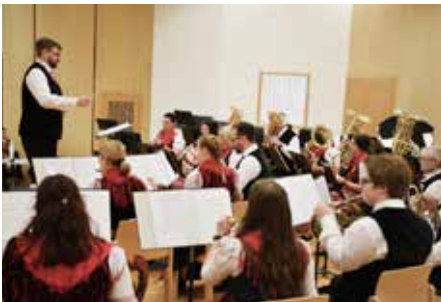
Konzertmusikbewertung in Grafenwörth.

Tag der Blasmusik: Am 22. April ging der Tag der Blasmusik bei schönstem Wetter erfolgreich über die Bühne. Die Trachtenkapelle Senftenberg bedankt sich recht herzlich für die zustande gekommene finanzielle Unterstützung, welche für die Anschaffung von neuem Notenmaterial und Instrumenten verwendet wird. Schon frühmorgens musizierte die Kapelle auf der Königsalm. Danach ging es mit der mobilen Bühne weiter Richtung Senftenberg, zu Mittag