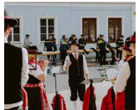
Auch das Maibaumsetzen in Senftenberg wurde von der Trachtenkapelle wieder musikalisch unterstützt.