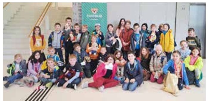
„Teddybär-Krankenhaus“ in der Karl Landsteiner Universität.