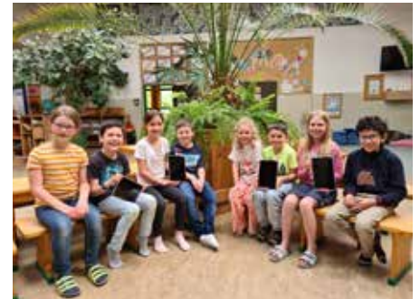
Elternverein sponsert zehn Tablets.

Tabletspende des Elternvereins: Danke an den Elternverein der VS Senftenberg, der die Schule am Weg in eine digitale Bildung großzügig mit zehn neuen Tablets unterstützt.