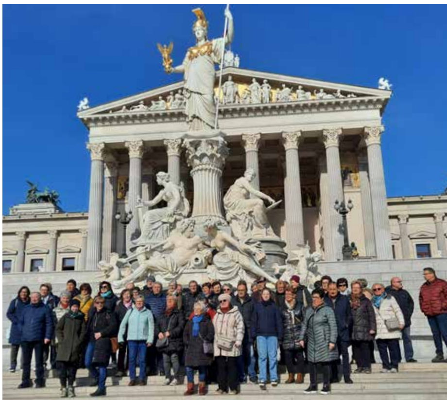
Der zweite Ausflug nach Wien brachte die SenftenbergerInnen ins Parlament und zum Wiener Zentralfriedhof, der nicht nur Ruhestätte, sondern auch eine riesige Parkanlage mit beeindruckender Flora & Fauna und Ort vieler Anekdoten ist.

Ausflug ins Parlament und zum Zentralfriedhof: Am 6. April waren über 50 TeilnehmerInnen beim Ausflug ins Parlament dabei und genossen eine sehr interessante und professionelle Führung im sanierten Gebäude. Allein die Anmeldung im Vorfeld und das Einchecken wie am Flughafen waren für die TeilnehmerInnen schon sehr spannend. Auch die anschließende Führung auf dem Wiener Zentralfriedhof war äußerst interessant und informativ.