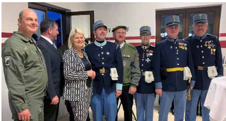
Verteidigungsministerin Klaudia Tanner und eine Delegation der Hesserbrigade Senftenberg bei der Bundesheer-Angelobung in Paudorf am 5. Mai 2023.

Es gibt eine Vielzahl weiterer Einladungen zu verschiedensten Festveranstaltungen, bei denen ein Auftritt in k.u.k. Uniformen erwünscht wäre, die aber aus akutem Personalmangel leider nicht wahrgenommen werden können. Es ergeht daher der dringende – wiederholte – Appell an die Bevölkerung im Verein mitzuarbeiten.