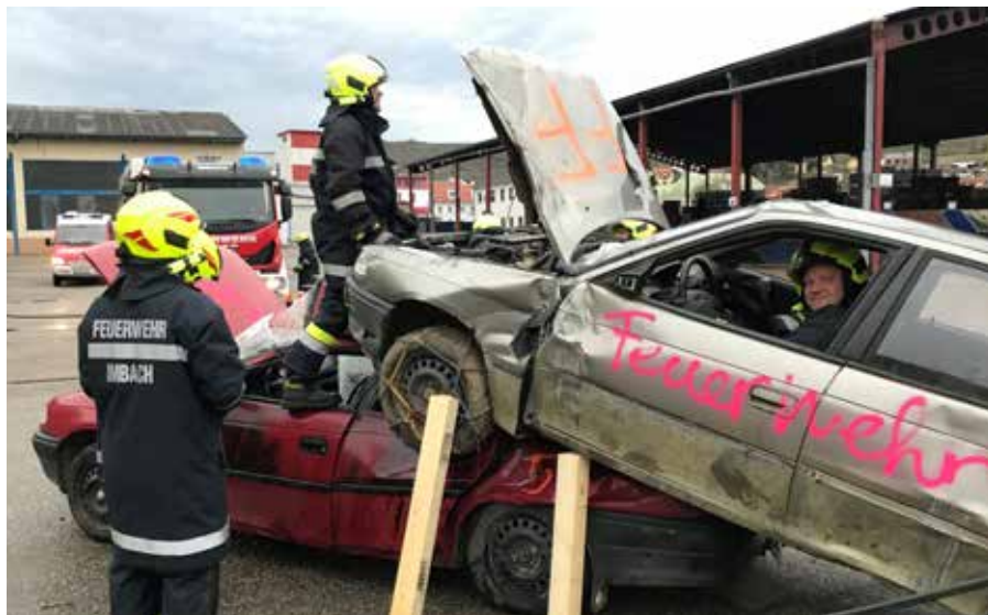
Feuerwehrübung mit Szenario eines Verkehrsunfalls.