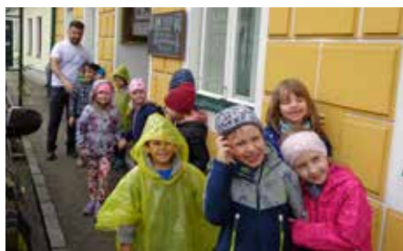
Besuch in der Pizzeria Halil.

Elternbeirat: Das Kindergartenteam möchte sich auch recht herzlich beim Elternbeirat bedanken, der den Kindergarten in vielerlei Hinsicht unterstützt. Sei es in finanzieller Weise oder in Form gemeinsamer Aktivitäten. Danke!