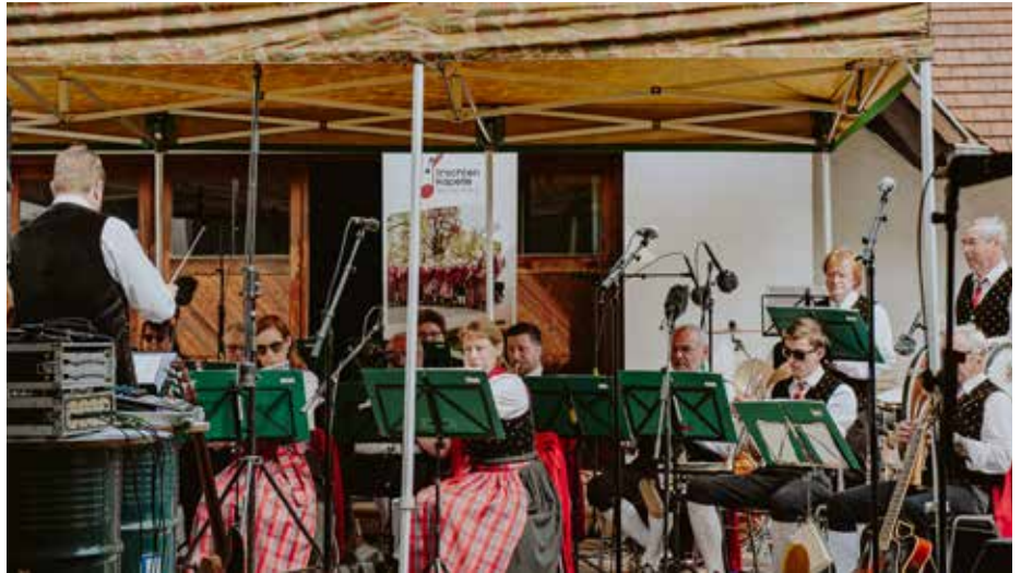
Ein besonderes Highlight war der Auftritt beim Radio-NÖ-Frühshoppen in Imbach.