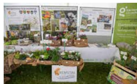
Ansprechend und informativ: Der Informationsstand der Kleinregion Kremstal.

region (Droß, Stratzing, Gedersdorf, Rohrendorf und Senftenberg), die durch ihre Mithilfe die Vorbereitung des eigenen Informationsstandes unterstützt haben.