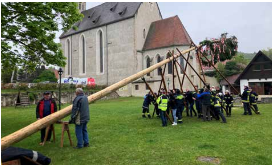
Maibaumaufstellen der Freiwilligen Feuerwehr Imbach im Klostergarten Imbach.

Wettkampfgruppe: Nach mehreren Jahren freut sich die FF Imbach, wieder eine Wettkampfgruppe für das dies-jährige Feuerwehrleistungsabzeichen aufstellen zu können. Bei diesem anspruchsvollen Wettbewerb geht es darum, möglichst schnell, aber auch korrekt eine Saugschlauchleitung (Was-