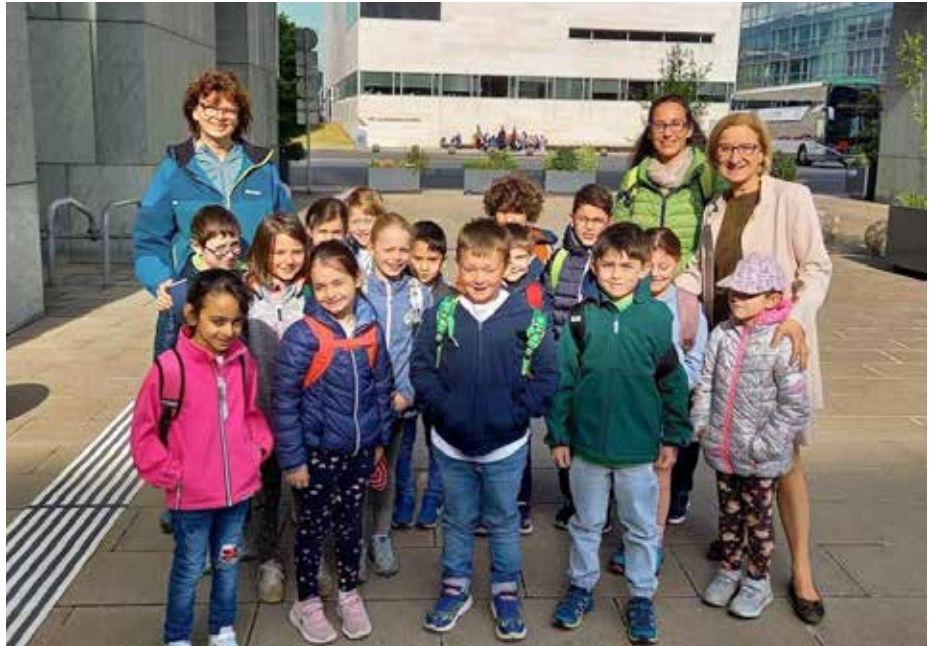
Treffen mit Landeshauptfrau Johanna Mikl-Leitner in der Landeshauptstadt.