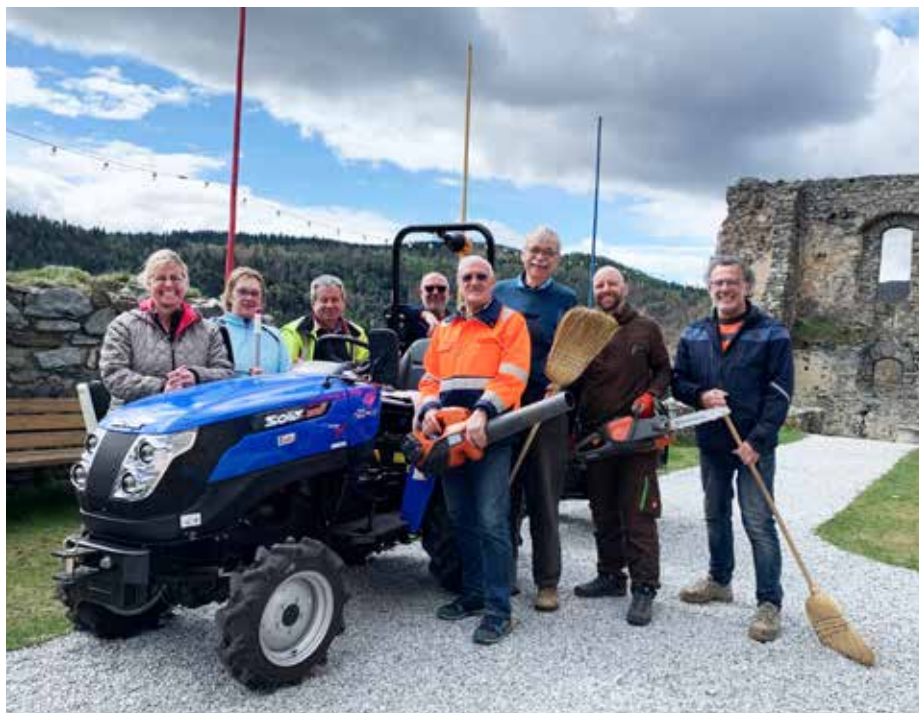
Gute Stimmung beim Frühjahrsputz in der und rund um die Burgruine.