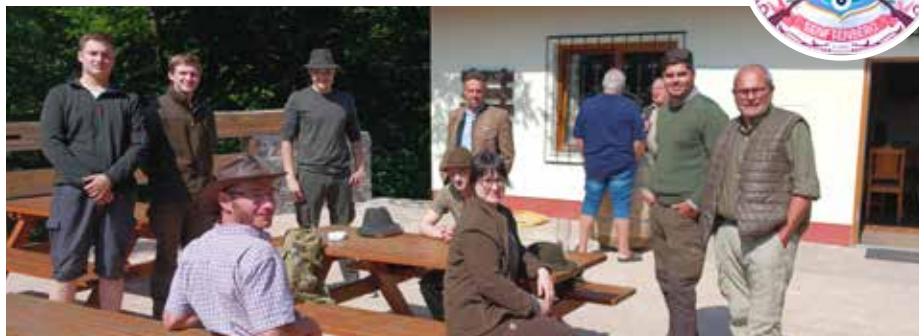
In Zusammenarbeit mit dem Landesjagdverband wurde die praktische Ausbildung der JungjägerInnen in Senftenberg durchgeführt.

Zusätzlich werden die Schießfertigkeiten der „Alt“-Jäger im Zuge der regelmäßig stattfindenden Hegeringschießen aufgefrischt, wo man sich zudem nicht nur untereinander im gemütlichen Rahmen wieder einmal austauschen kann, sondern auch dem Thema Sicherheit große Bedeutung beigemessen wird. Neben dem jagdlichen Schwerpunkt kommen natürlich auch die sportlichen Aktivitäten nicht