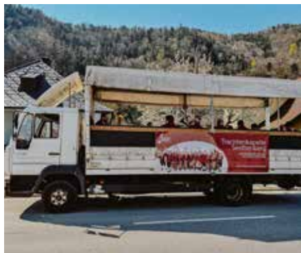
Seit 15 Jahren ist die mobile Bühne von Jochen Braun am Tag der Blasmusik im Einsatz.