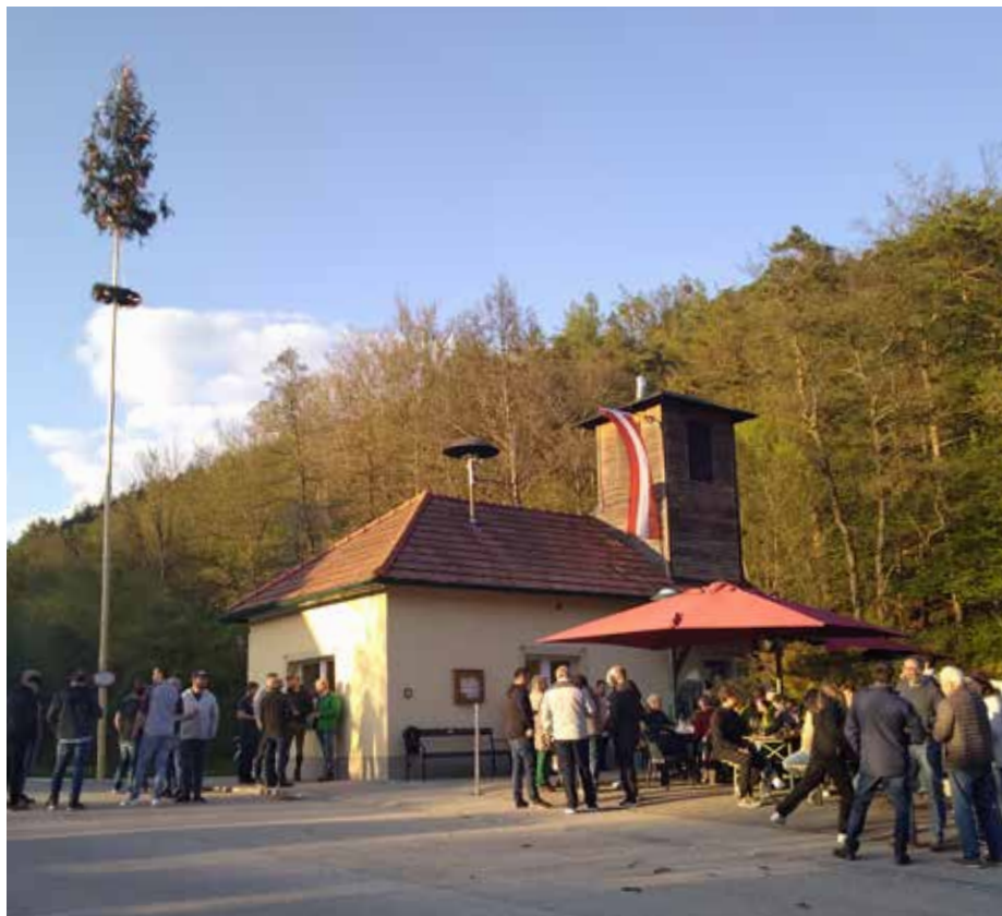
Das Maibaumsetzen am 30. April war wieder ein gelungenes Fest der Königsalmer.

Heuer feierte der Königsalmer Dorfverein das traditionelle händische Maibaumaufstellen am 30. April. Die Tage davor machte das Wetter den Eindruck, dass sich alle warm anziehen und alles