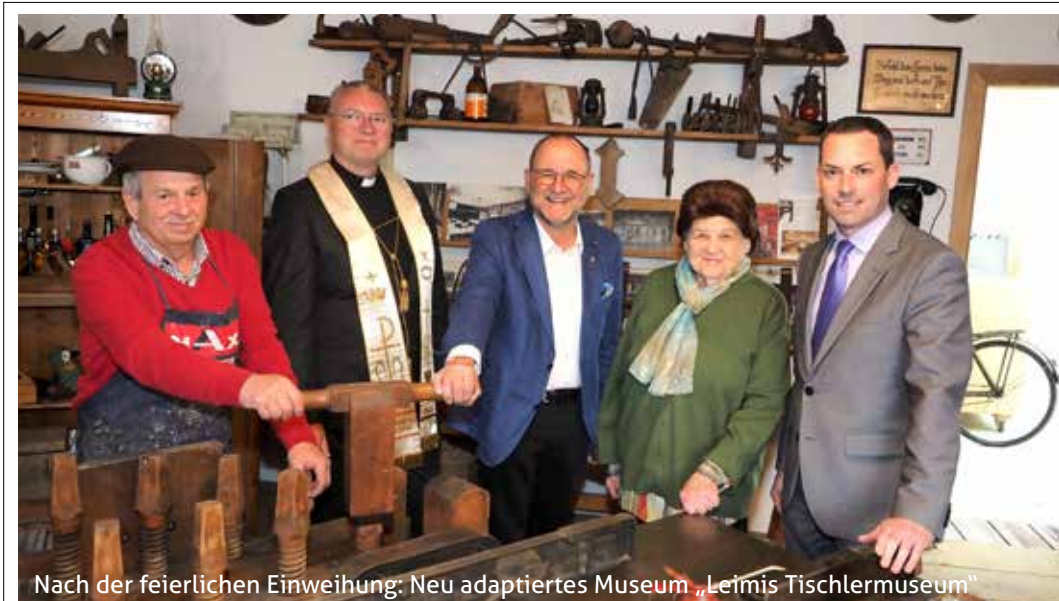
Nach der feierlichen Einweihung: Neu adaptiertes Museum „Leimis Tischlermuseum“

„DAS LEBEN BESTEHT NICHT NUR AUS NEHMEN, WIR SOLLTEN STEHTS AUCH GEBEN.“