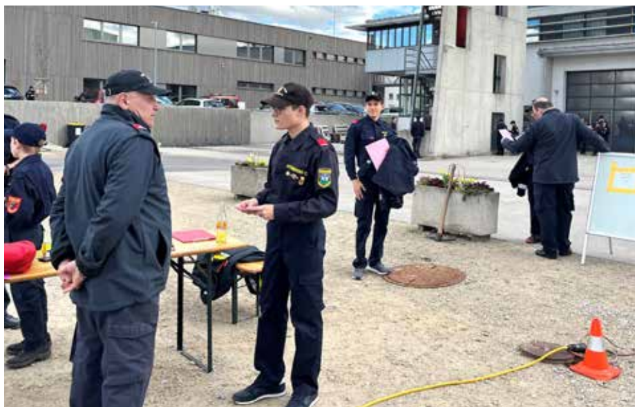
Geprüft auf Herz und Nieren: Beim Wissenstest schlugen sich alle acht Jungfeuerwehrmitglieder erfolgreich und dürfen sich über verdiente Auszeichnungen freuen.

FeuerwehrJugend: Beim Wissenstestspiel und Wissenstest in Langenlois am 25. März konnten alle Teilnehmer ihr