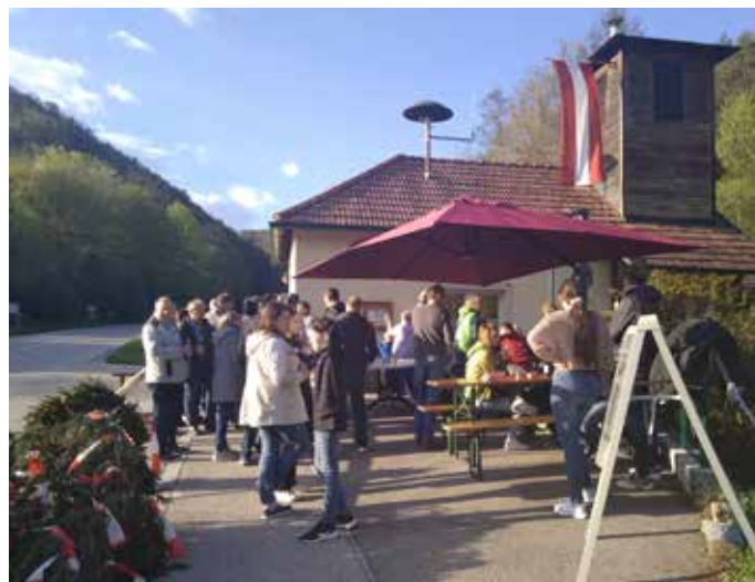
Bei strahlendem Wetter ging das Maibaumfest über die Bühne.