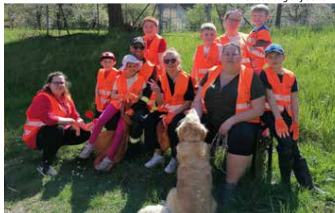
Frühjahrsputz mit Beteiligung der FF Imbach.