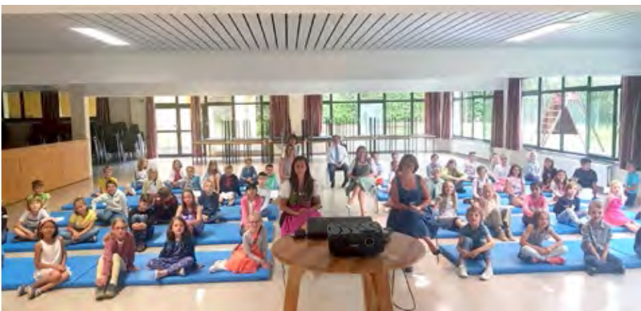
Aufgrund der Corona-Maßnahmen gab es statt des Gottesdienstes zum Schulschluss nur eine kleine Feier in der Veranstaltungshalle.