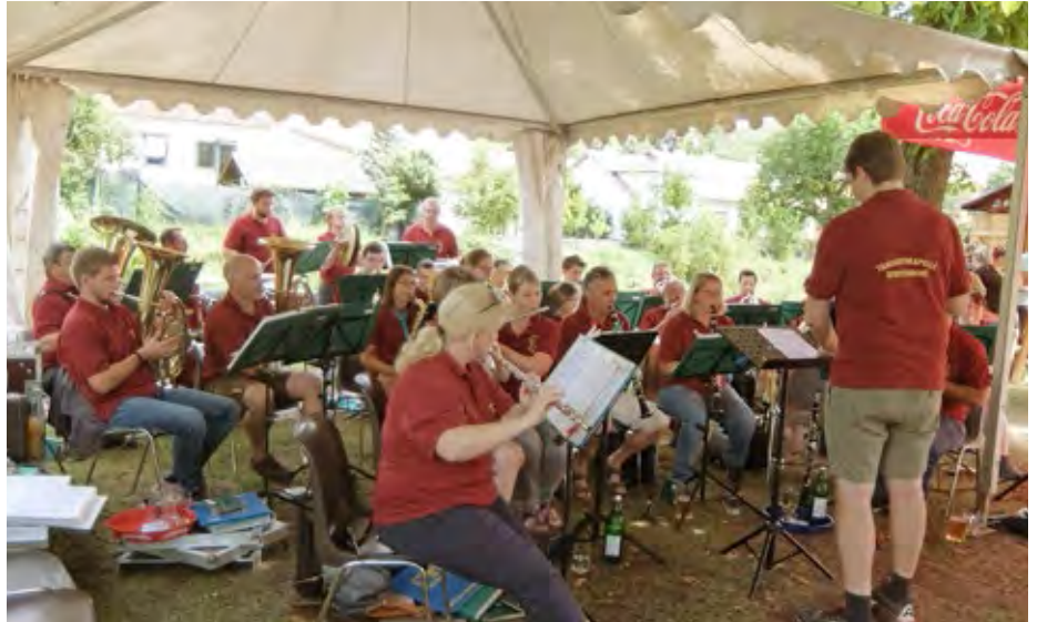
„Musikanten im Park“ – Frühschoppen mit der Trachtenkapelle.