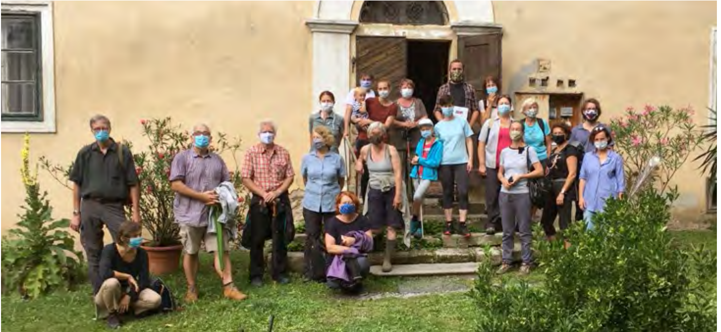
Erstes Ziel der Kulturwanderung im August war das Beethovenhaus in Gneixendorf.

Beethoven und Venus vom Galgenberg: Trotz der schwierigen Corona-Zeiten nahm der Kulturdenkmalverein Imbach mit einer Reihe von Kulturwanderungen seine Arbeit wieder auf.