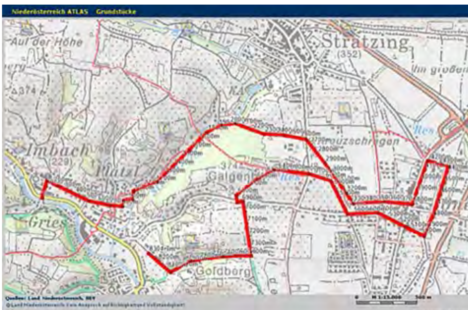
Wanderroute der 1. Kulturwanderung