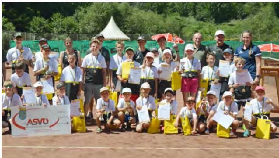
Abschluss der Campwoche am Wettbewerbstag.