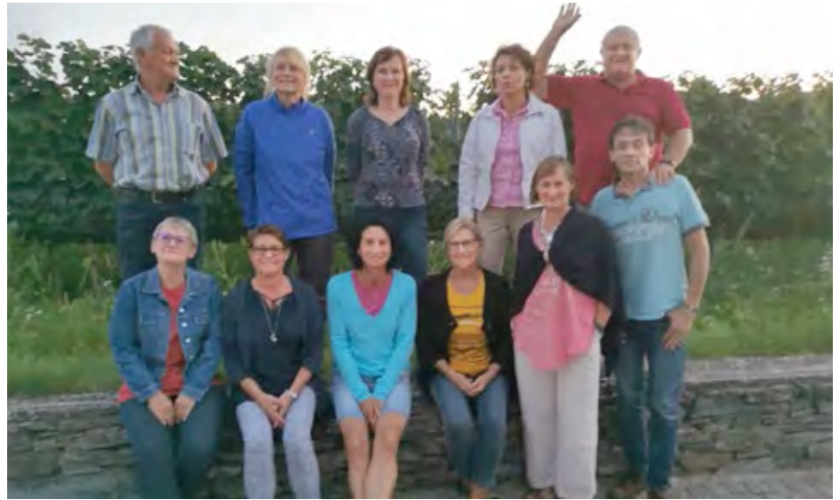
Das Team der Linedancers sorgte für Country-Feeling im Park.

Gemeinsam mit der Senftenberger Jugend gelang es den Linedancers, an „ihrem“ Wochenende ein ganz besonderes Flair in den wunderschönen Park zu bringen und die Gäste bewunderten die gute Stimmung und das besondere Ambiente. – „Wir hoffen jedoch, dass