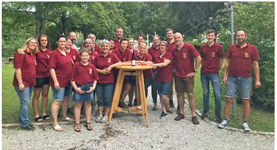
Die Trachtenkapelle bedankt sich bei den Besuchern von „Sommer im Park“.