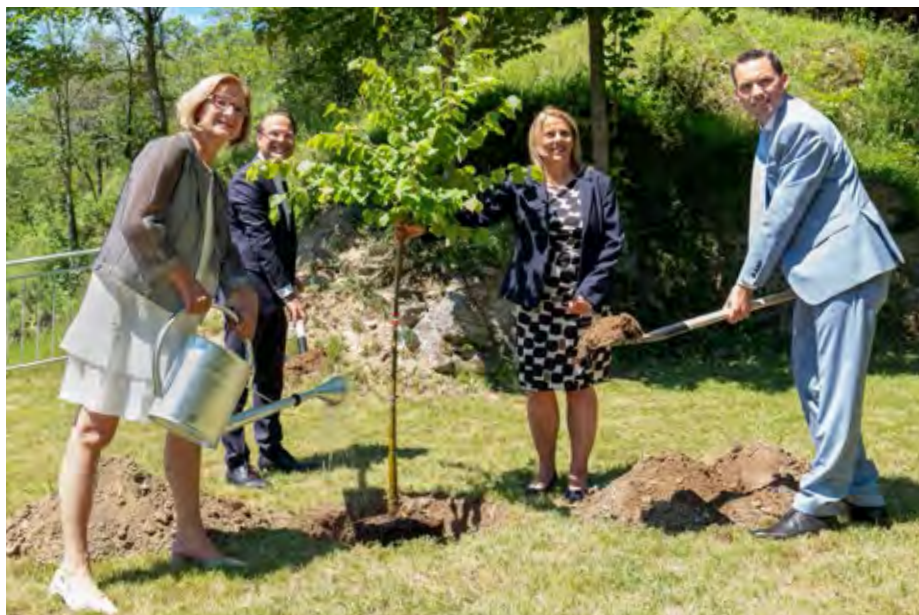
Auf einer Fläche von rund 6.500 Quadratmetern soll ein öffentlich zugänglicher Waldpark für Einheimische, Patienten und Touristen entstehen.

Auf unterschiedlichen Therapiestationen wird für Gäste und Einheimische die Möglichkeit geschaffen den Wald zu genießen, selbst die heilsame Wirkung zu erfahren und dabei Stress abzubauen.