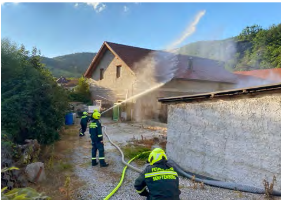
Feuerwehrübung der FF Senftenberg beim Anwesen Eichelmann.

Abschnittsfeuerwehrkommandos Krems Land tätig. 2016 wurde er zum Kommandantstellvertreter und überörtlich zum Abschnittsfeuerwehrkommandanten der 19 Feuerwehren des Abschnittes Krems gewählt. Die Freiwillige Feuerwehr Senftenberg gratuliert auf das Herzlichste.