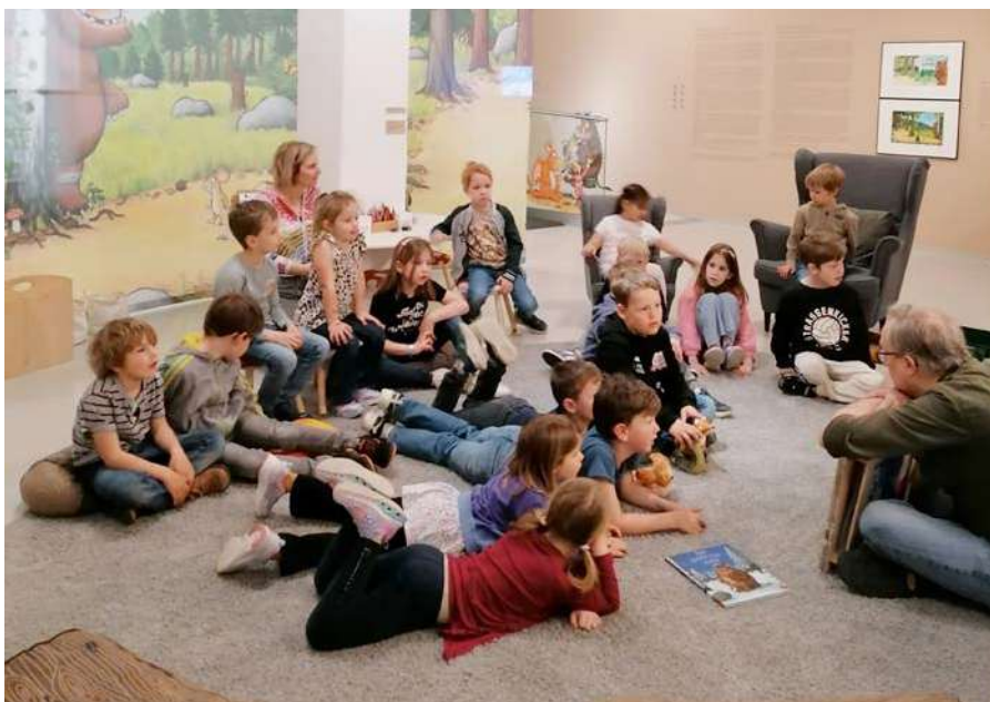
Die Grüffelo-Geschichte zieht alle in ihren Bann.