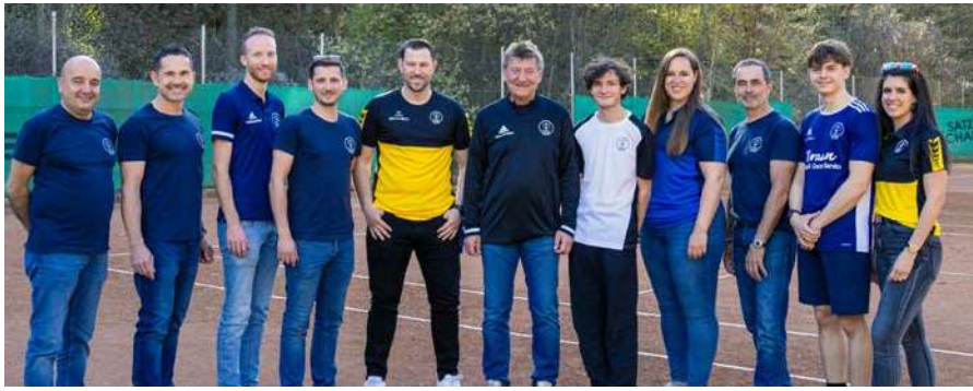
STK Vorstand