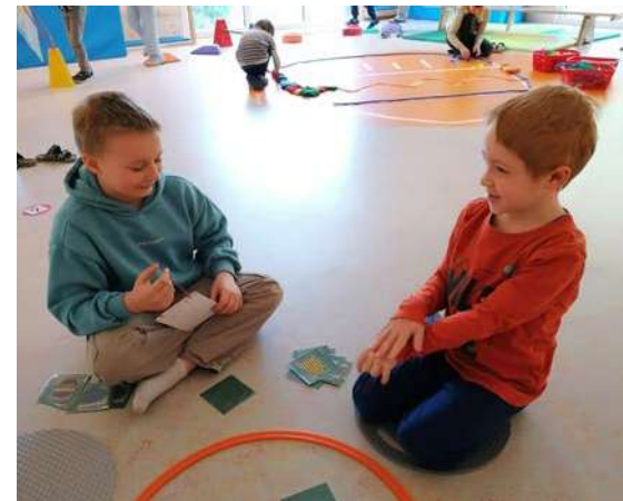
Spielerisch den Übergang gestalten: Kinder aus Kindergarten und Schule im Miteinander.

Im Rahmen der Zusammenarbeit zwischen Kindergarten und Volksschule gab es Besuche auf beiden Seiten. Dabei fanden verschiedene gemeinsame Aktivitäten mit Kindern, die heuer eingeschult werden, statt. Die Treffen waren für die Kinder ein schönes Erlebnis und halfen beim Kennenlernen.