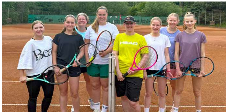
Damenmannschaft 2026

Ab Mai bestreiten die Meisterschaftsmannschaften des Vereins ihre Spiele. Neben der Herrenmannschaft und den beiden Jugendmannschaften, tritt heuer erstmalig nach vielen Jahren eine Damenmannschaft an. Ein toller Schritt in Richtung Zukunft, um weiterhin allen begeisternden ein Betätigungsfeld bieten zu können.