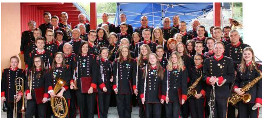
Musikkapelle des Bürgerkorps Eggenburg