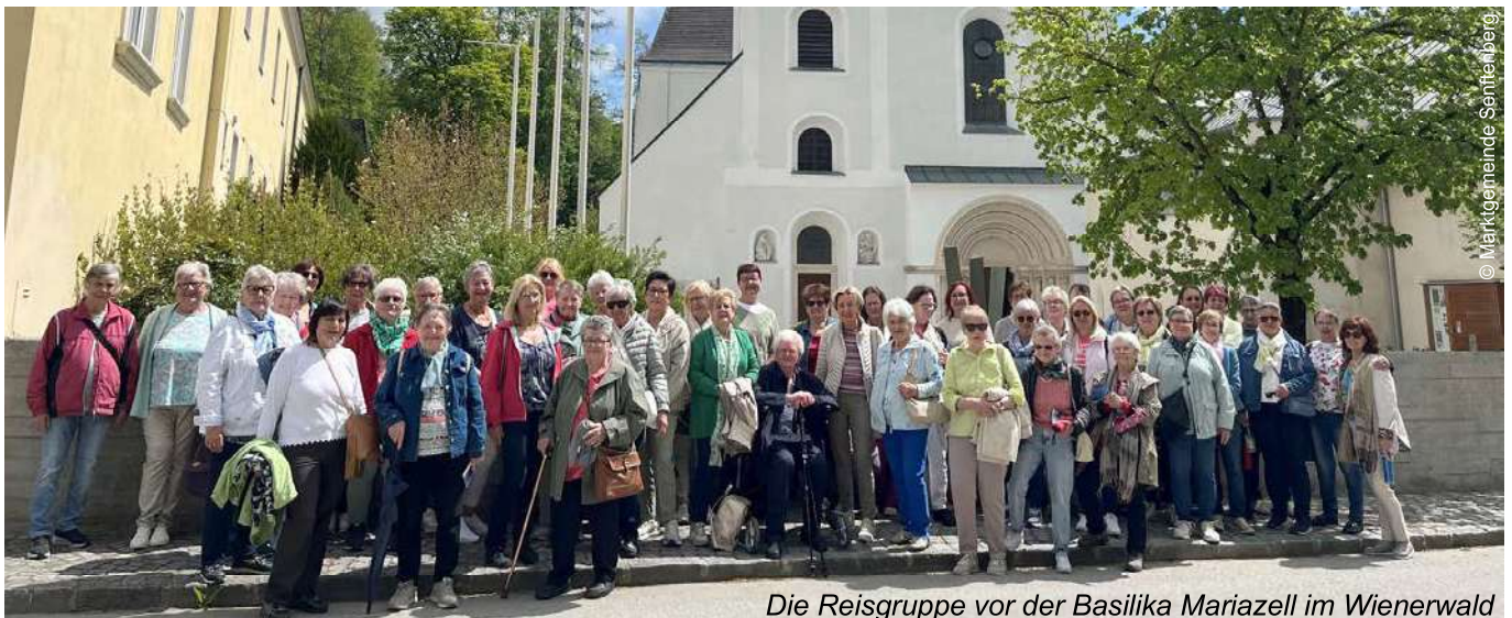
Die Reisegruppe vor der Basilika Mariazell im Wienerwald