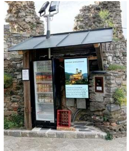
Getränkkekühlschrank und Info-Point

Das neue Burgstüberl hat den Getränkekühlschrank und den Bildschirm „verdrängt“. Rasch wurde ein neuer Platz gefunden, eine Überdachung gezimmert und ein neuer 49" Screen angeschafft. Für unsere Besucher ist dieser neue Standort zentraler und die Infos auf dem Bildschirm leichter und besser lesbar.