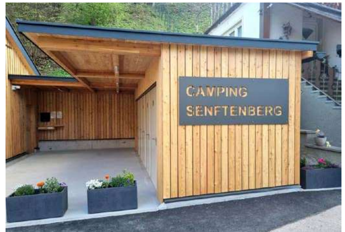
Sanitäreinrichtung Campingplatz 2026