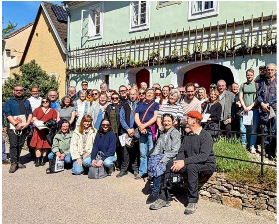
Die internationalen Expert*innen der Fachexkursion des Arbeitskreises für Hausforschung Österreich vor dem Haus Kirchengasse 10 in Imbach.

Am Samstag, dem 26. April 2026, besuchte der Arbeitskreis für Hausforschung Österreich im Rahmen seiner