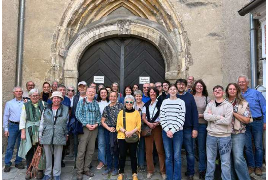
Die Teilnehmer*innen der 5. Kulturfahrt vor dem Nordportal der ehemaligen Klarissenklosterkirche in Dürnstein.

Exkursion. Die frühgotische Klosterkirche wurde 1716 durch den Barockbaumeister