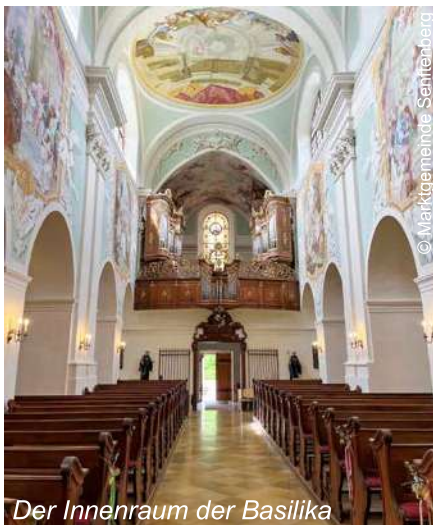
Der Innenraum der Basilika