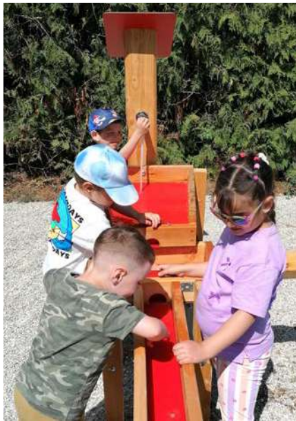
Mit großer Begeisterung nutzen die Kinder den neuen Wasserlauf zum Forschen.

Dabei wird besonderer Wert auf einen bewussten und sparsamen Umgang gelegt. So verbindet der Wasserlauf Spielspaß mit wichtigen Lernerfahrungen und ist eine wertvolle Ergänzung im Alltag der Kinder. Ein herzliches Dankeschön gilt der Gemein-