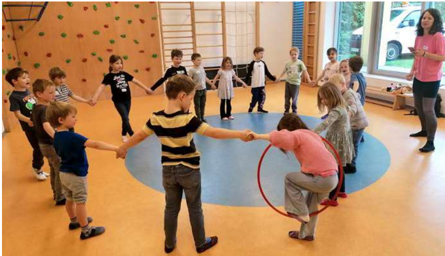
Aktives Lernen und Entdecken im Workshop.