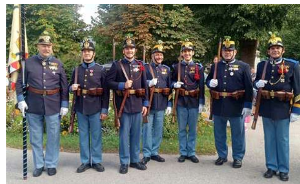
Abordnung des Deutschmeister