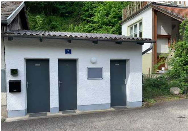
Sanitäreinrichtung Campingplatz 2021