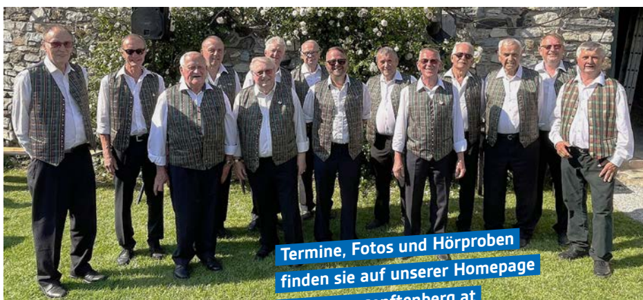
Singen auf der Burg 2025