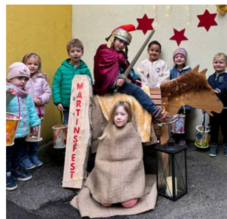
Laternenfreude fürs Martinsfest

Auch das Martinsfest bringt mit leuchtenden Laternen und fröhlichen Liedern Wärme in die dunklere Jahreszeit,