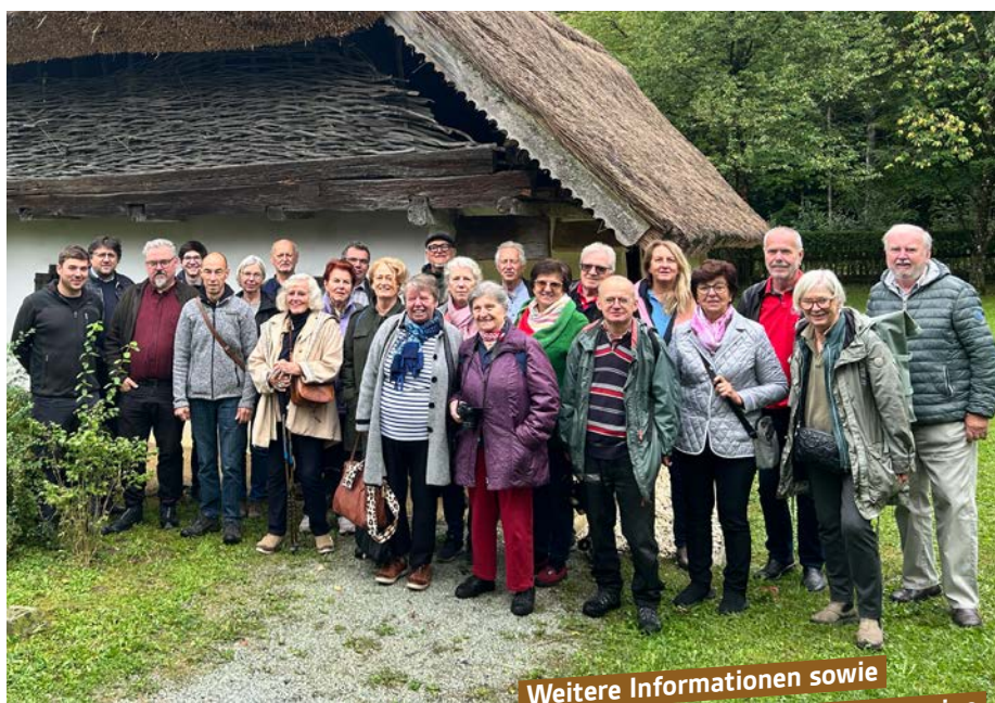
Die Teilnehmer*innen der 4. Kulturfahrt im Freilichtmuseum Bad Tatzmannsdorf.