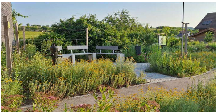
Das Siegerprojekt der Marktgemeinde Senftenberg: die Gemeinschaftsplätze Priel.