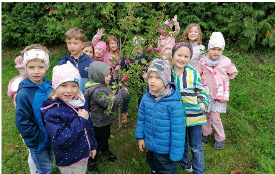
Kinder ernten Äpfel für das Erntedankfest

Ein weiterer Fixpunkt im Tagesablauf sind spielerische Englischstunden, die alle zwei Wochen von Frau Helldorff angeboten werden. Danke an die Gemeinde für das Englischangebot!