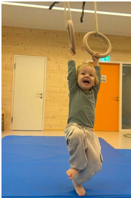
Bewegung ist wichtig und macht großen Spaß

Seit über einem Jahr freuen wir uns über unser neu ausgebautes Kindergartenhaus mit viel Platz und guten Möglichkeiten für Bewegung und Spiel. Bewegung ist ein wichtiger Bestandteil in unserer Kindergartenarbeit. Besonders freuen wir uns über zwei Bewegungsräume, die täglich genutzt werden.