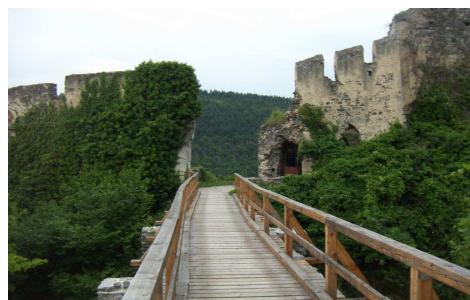
Brücke zur Burg